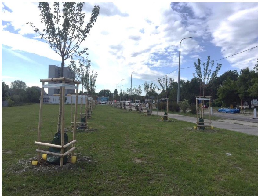
Obr. č. 2. : Novovysadené dreviny druhu Prunus serrulata 'Kanzan' (Citarová, 2020).

Žiadna z uvedených drevín nepatrí medzi chránené druhy a ani žiadna z nich nebola vyhlásená za chránený strom v zmysle vyššie uvedených legislatívnych predpisov.