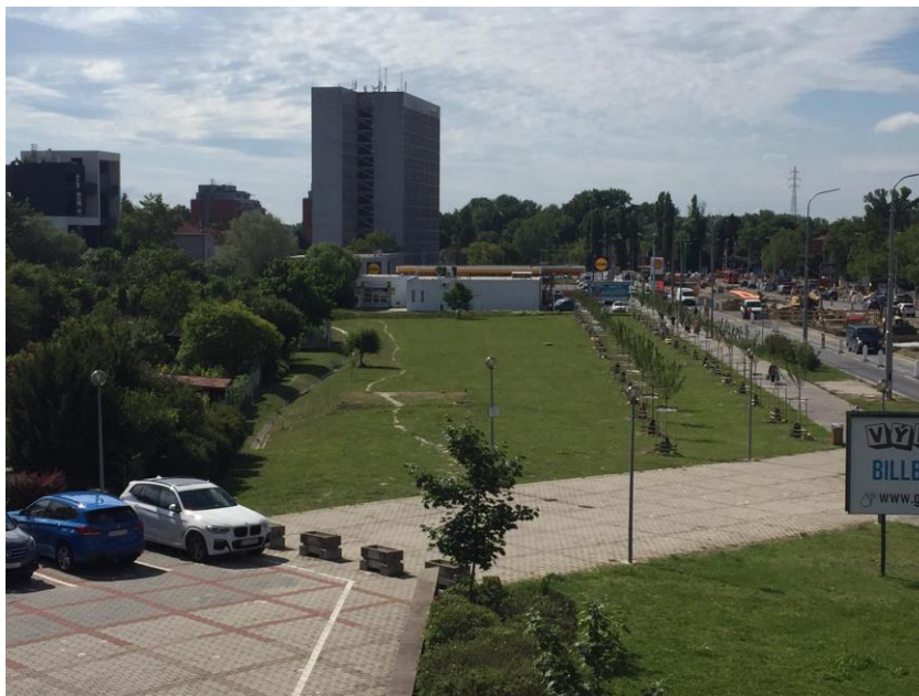
Obr. č. 1. : Pohľad na riešené územie (Citarová, 2020).