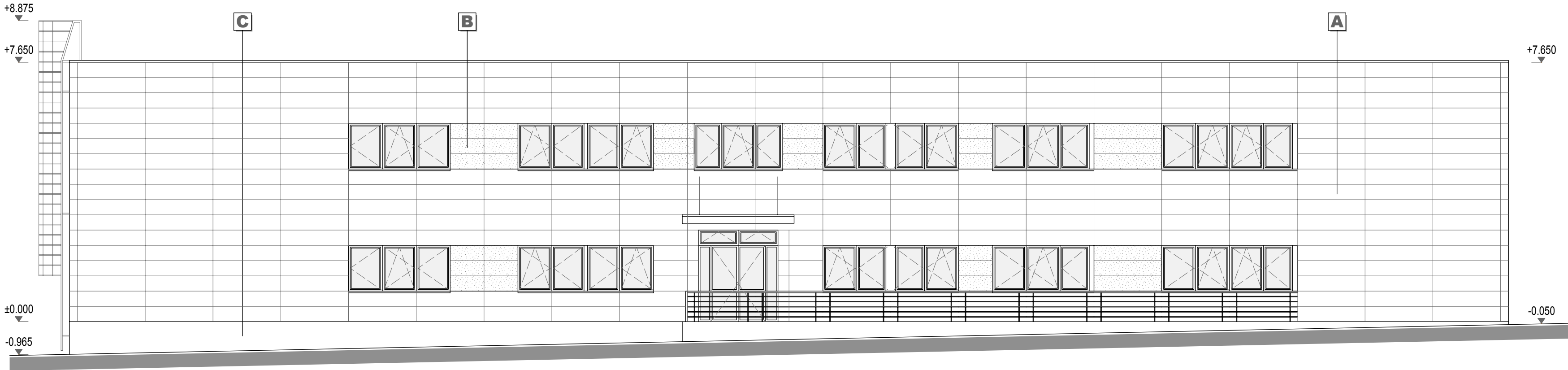
POHĽAD ČELNÝ - SEVEROVÝCHODNÝ