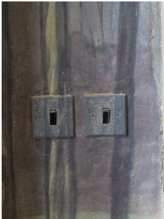
Detaily nevyhovujících utilitárních zásahů, denní osvětlení.