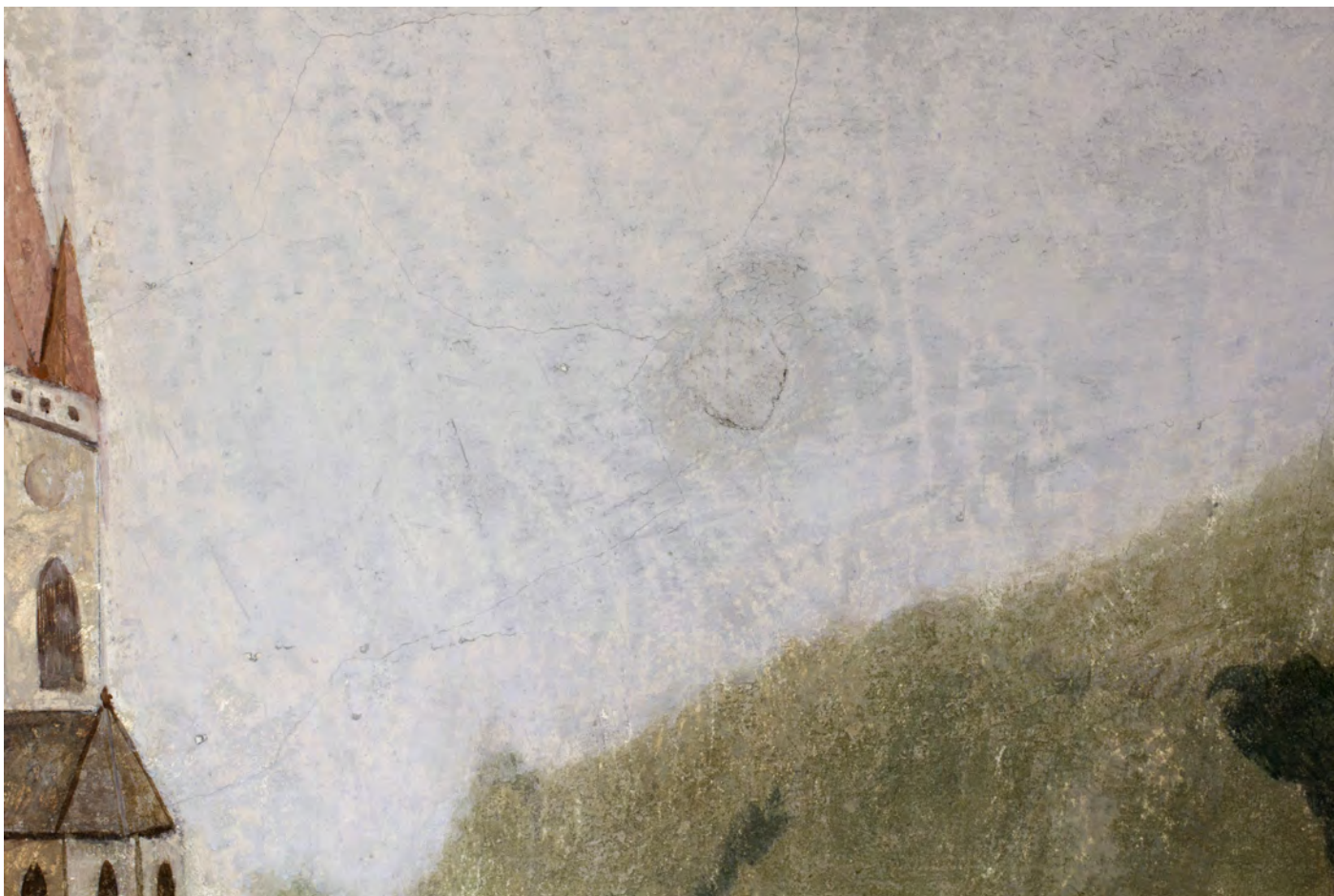
Detaily defektů a druhotných zásahů v barevné vrstvě, denní osvětlení.