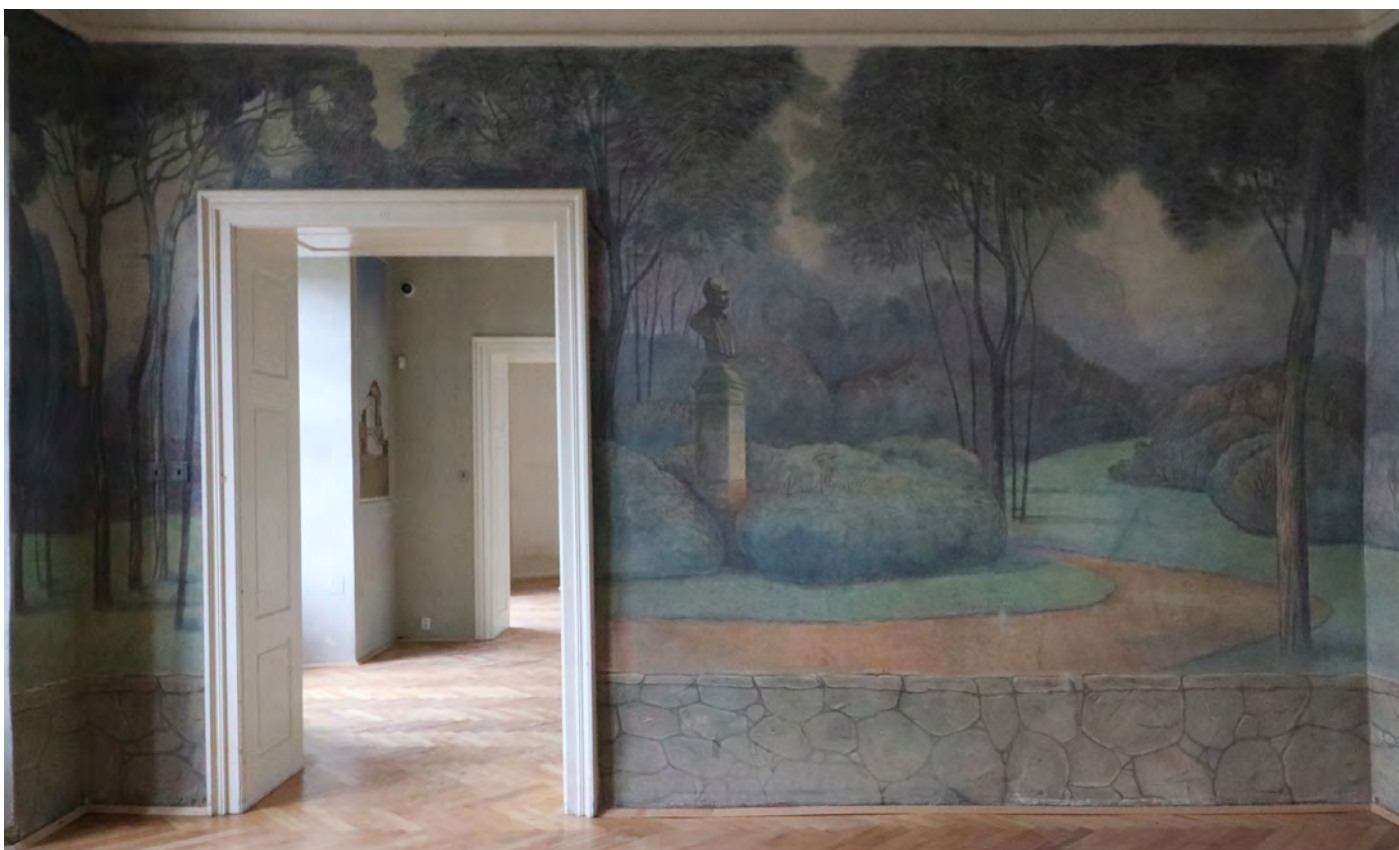
Obraz na boční stěně, denní osvětlení.