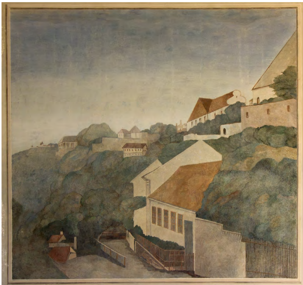
Obrazy na bočních stěnách, denní osvětlení.