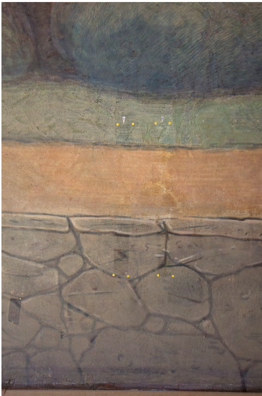
Detail zkoušek snímání povrchových nečistot a ztenčování druhotných zásahů, denní osvětlení.