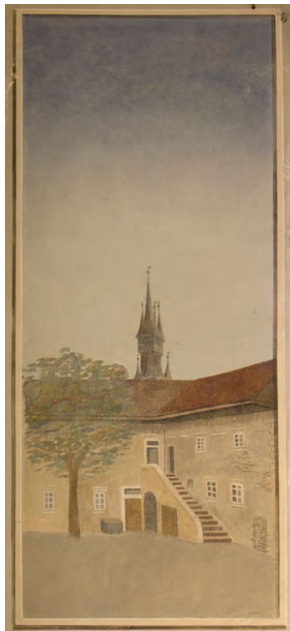
Obrazy na stěně s okny, denní osvětlení.