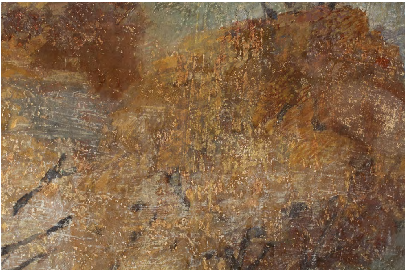
Detaily defektů a druhotných zásahů v barevné vrstvě, denní osvětlení.