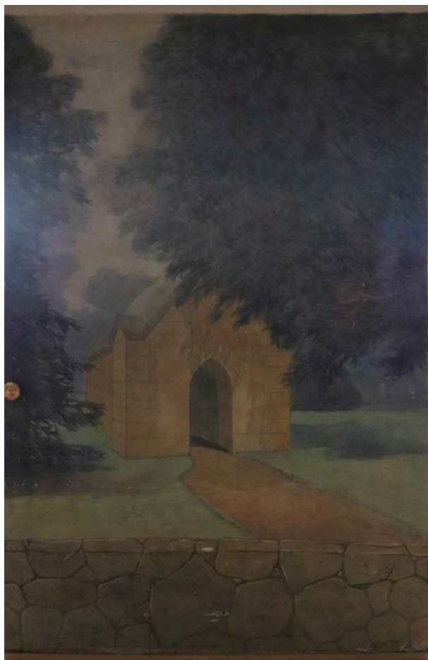
Obraz na boční stěně u oken, denní osvětlení.