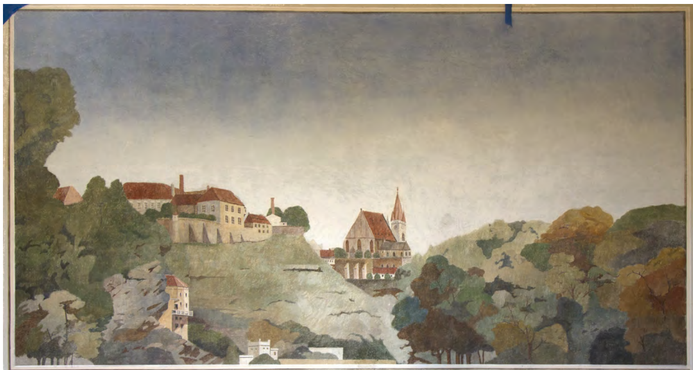
Celkový pohled na centrální nástěnný obraz, denní osvětlení