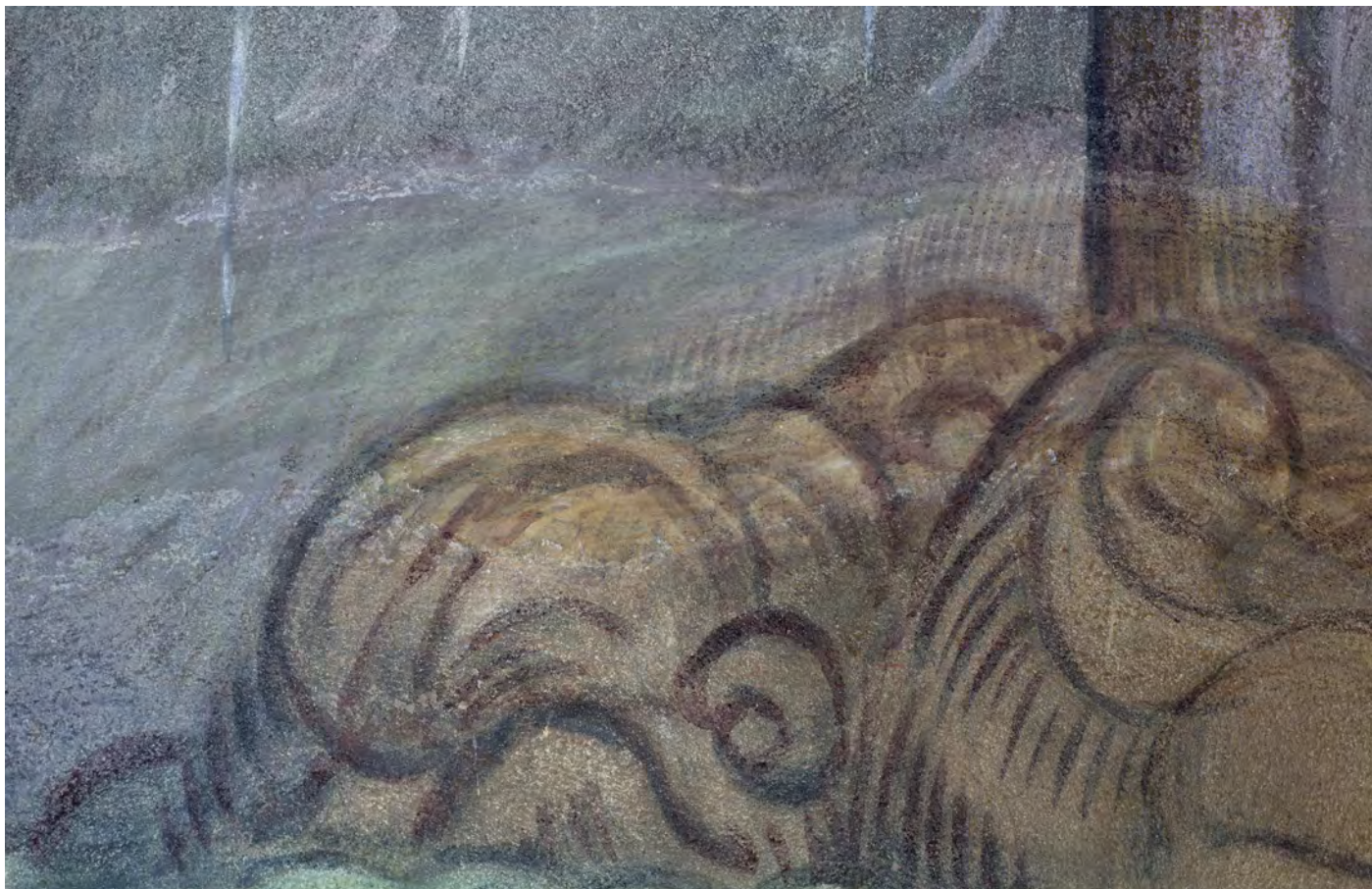
Detaily defektů a druhotných zásahů v barevné vrstvě, denní osvětlení.