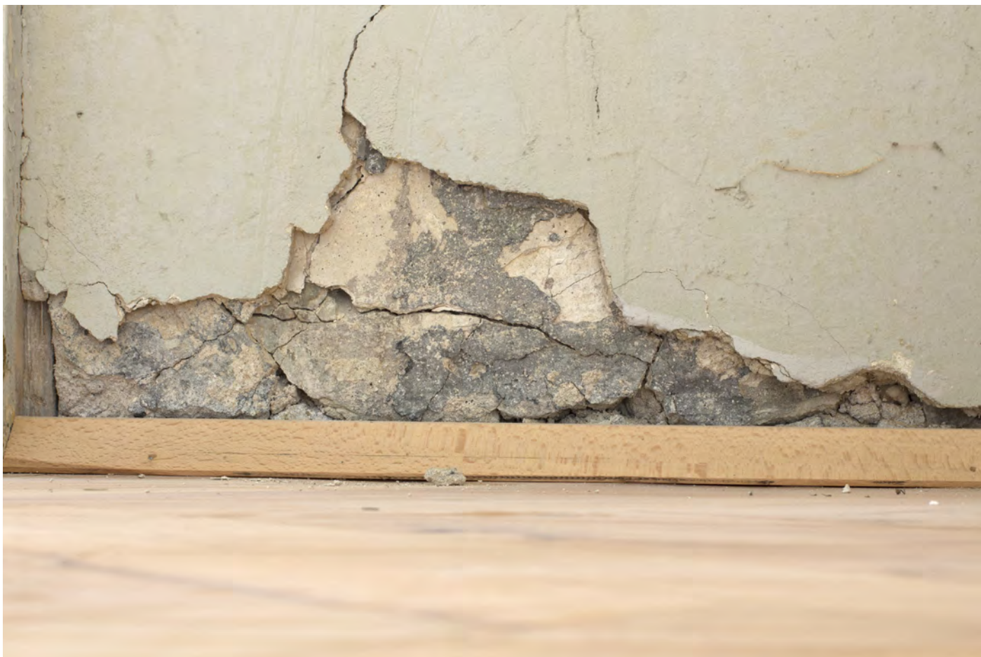
Defekty druhotné štukové vrstvy překrývající historickou omítkovou vrstvu, detaily v denním osvětlení.