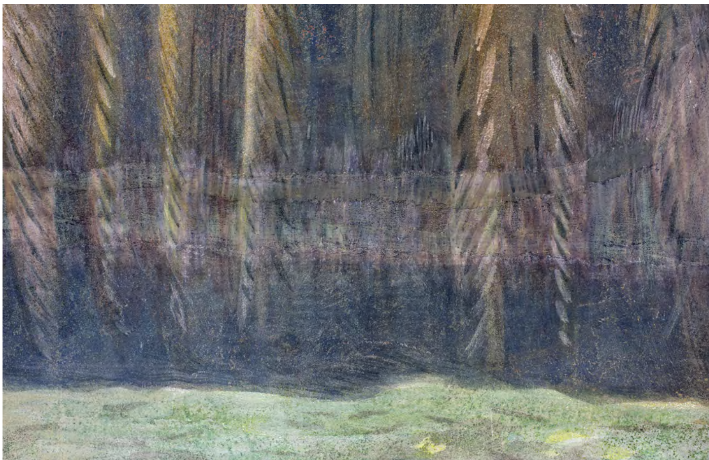
Detaily defektů a druhotných zásahů v barevné vrstvě, denní osvětlení.