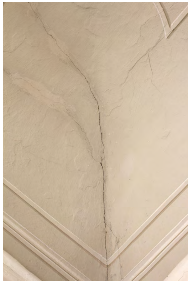
Statické trhliny nástropního obrazu, detaily v denním osvětlení.