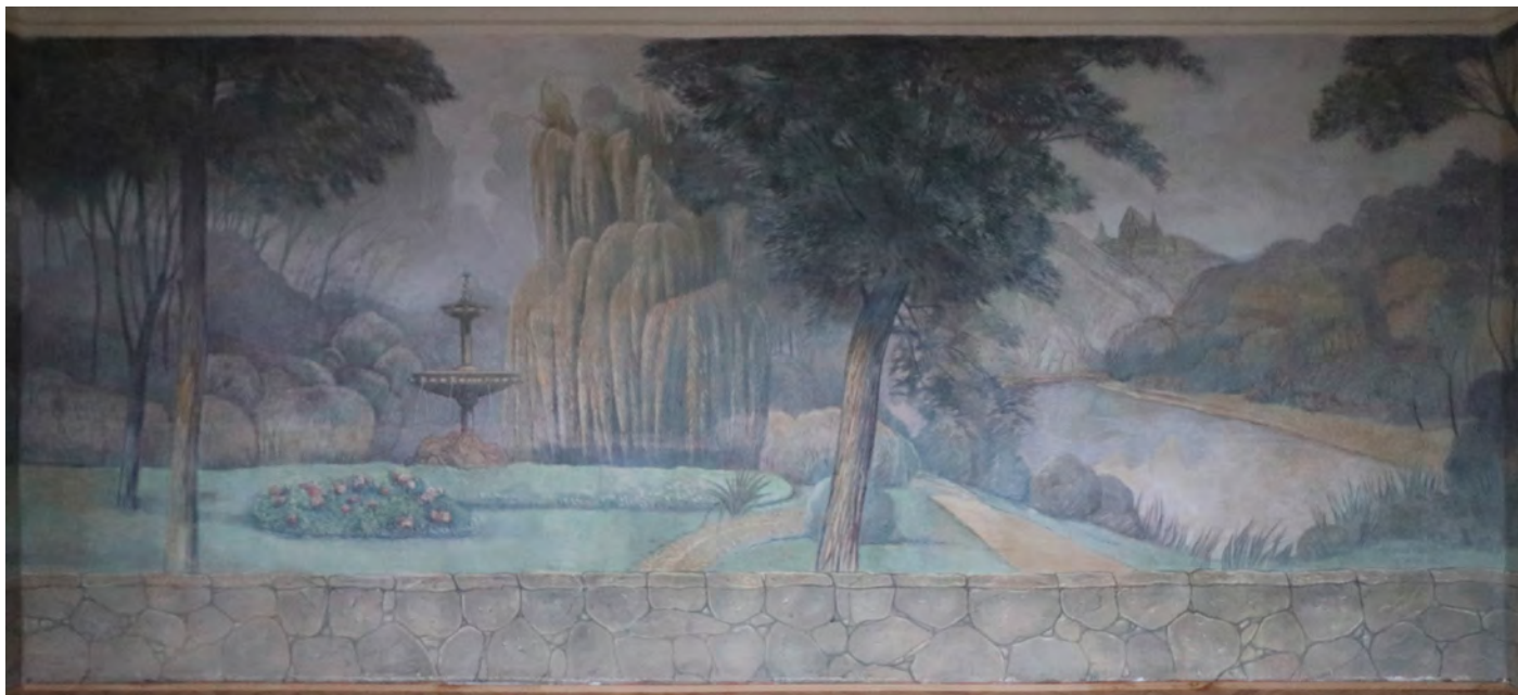
Celkový pohled na centrální nástěnný obraz, denní osvětlení