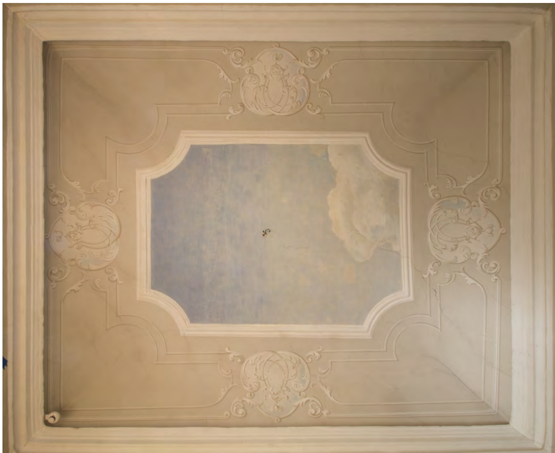
Celkový pohled na nástropní malbu, denní osvětlení.