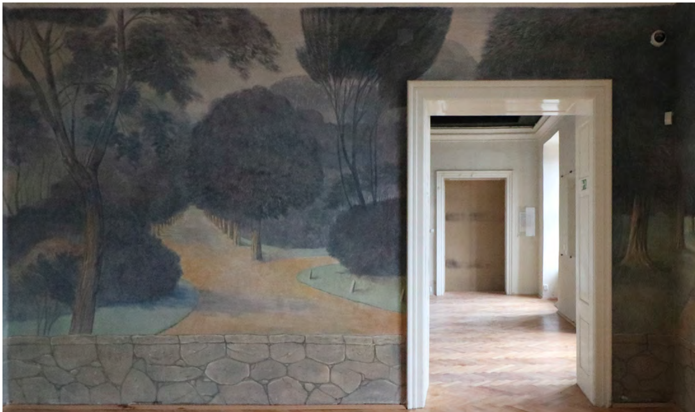
Obraz na boční stěně, denní osvětlení.