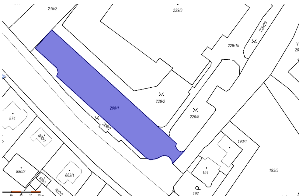
Obrázek č.4 - Katastrální mapa - parcela 208/1

Uvedené parcely jsou zobrazeny na obrázcích níže.