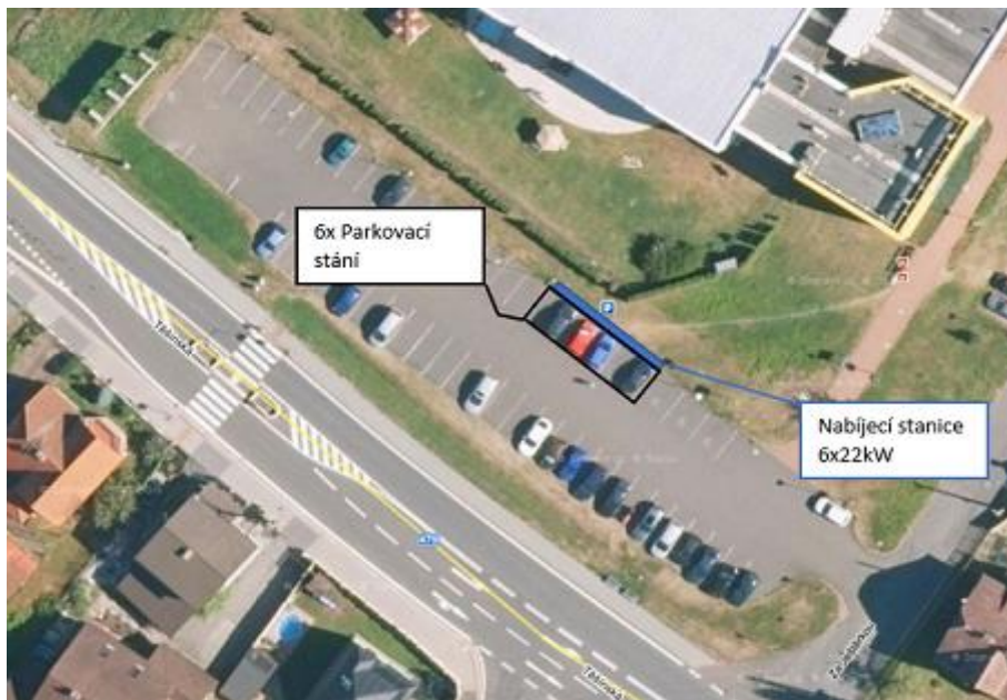
Obrázek č.5 - Fotografie umístění nabíjecí stanice včetně parkovacích míst

Šest nabíjecích stanic bude umístěno na stávajícím parkovišti u Ozdravného centra Ještěrka. Pro parkování i nabíjení se využijí stávající parkovací místa sousedící se zeleným pásem. Betonové základy pro nabíjecí stanice budou umístěny vždy na rozhraní dvou parkovacích míst v zeleném pásu. Jeden betonový základ bude určen pro jednu konzolu sloužící jako držák dvou nabíjecích stanic. Zákres umístění nabíjecích stanic včetně parkovacích míst je k vidění na Obrázku.