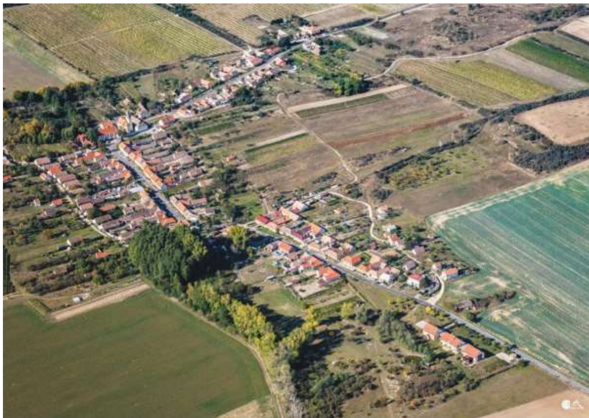
Popice – letecký snímek