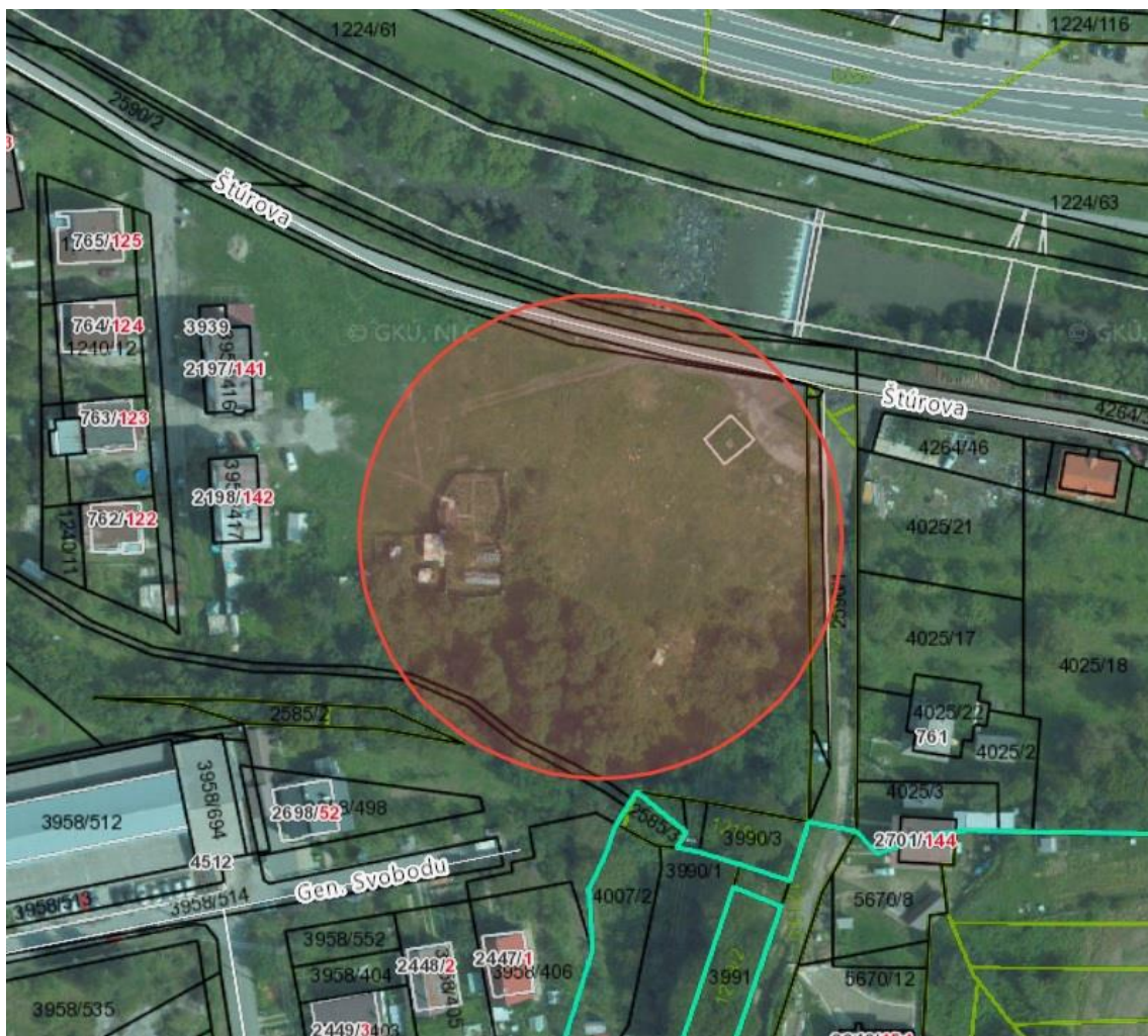
- výrez z územného plánu