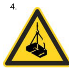
Nebezpečenstvo pádu alebo pohybu zaveseného bremena