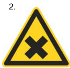
Nebezpečenstvo škodlivej alebo dráždivej látky