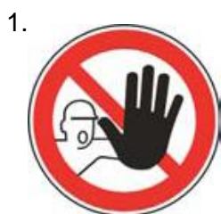
Nepovolaným vstup zakázaný (spolu so značkou č.2, 3 alebo 4 a príslušnou dodatkovou tabuľou)