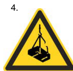
Nebezpečenstvo pádu alebo pohybu zaveseného bremena