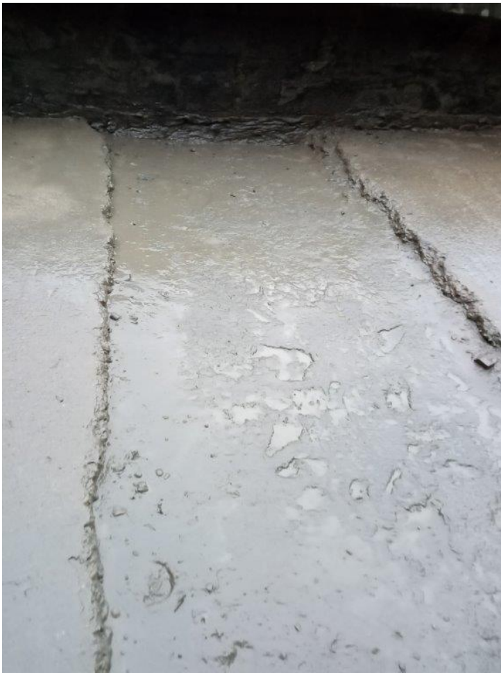
• ryha na betónovej ploche strešného pláštá