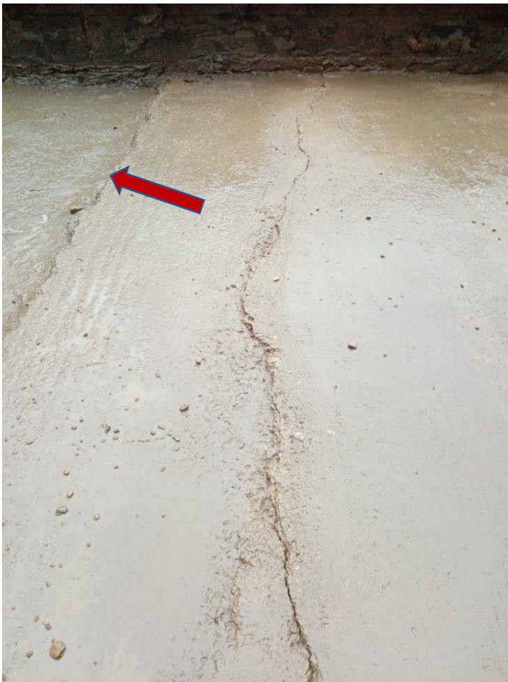
• okraj ryhy na betónovej terase