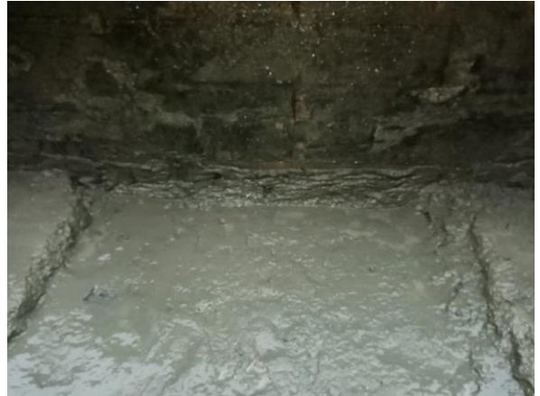
• detail ryhy pri atike