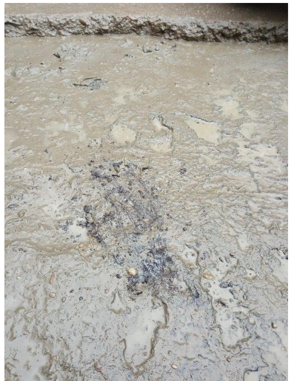
• detail ryhy (asfalt. zálievka/ asfalt. lepenka)