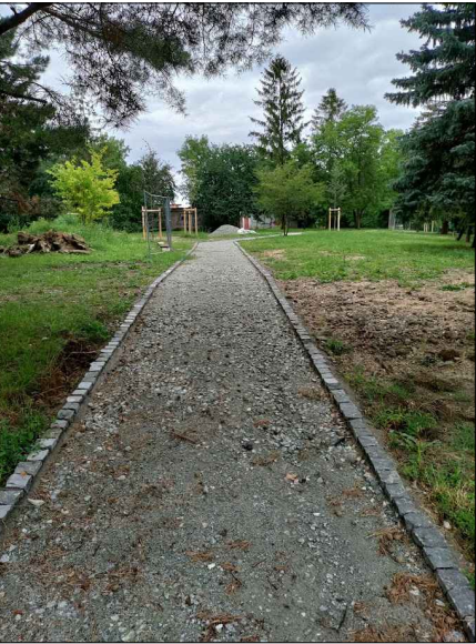
OBRUBNÍKY Z KAMENNÝCH KOCIEK