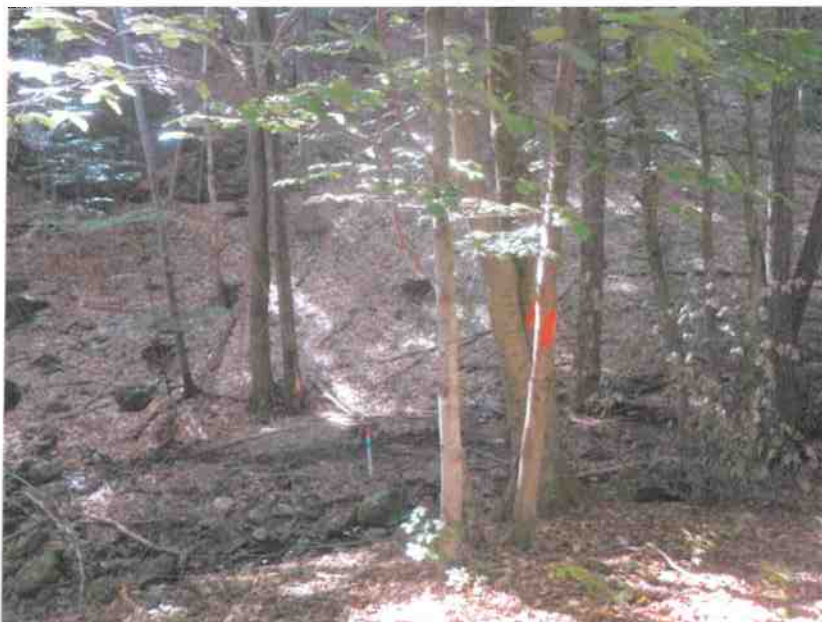
Obr. č.1. Pohľad na profil terénu v mieste hrádze v doline vysychajúceho toku Chotinka.

Udržiavanie prevádzkovej hladiny na kóte 428,20 so stálym objemom 2 278,99 m 3 umožňuje vytvoriť retenčný priestor o objeme 1358 m 3 , čo transformuje povodňovú vlnu a spomaľuje odtok.