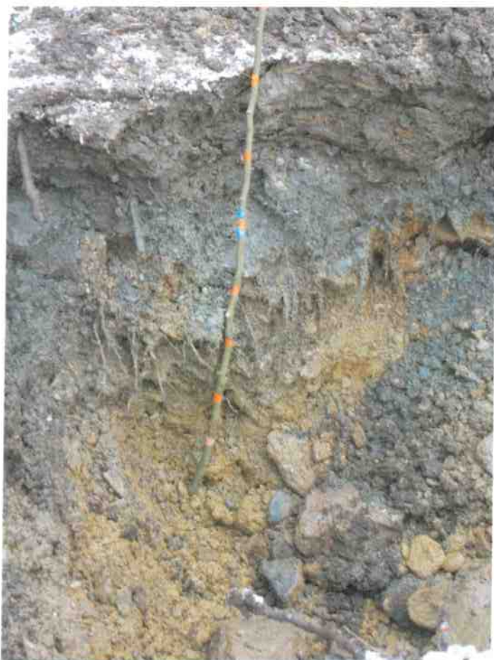
Obr. č.4. Ílovito- hlinité podložie tvorí nadložie štrkovým zahlineným laviciam.

Násypy po stranách kamennobetónovej hrádze budú realizované z miestneho výkopu - materiálov F4-CS a ílové tesnenie zo zeminy F6-CI. Priesaky hrádze budú sústredené do trativodu s obsypom na vzdušnej strane hrádze drenážnym potrubím PVC DN 160 v dvoch vetvách dl=2 x 25 m do výtokového betónového boku za vývariskom na výtok.