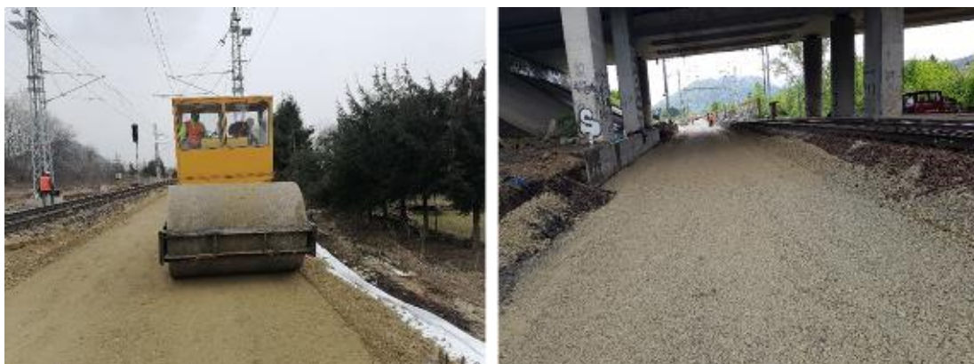
Obr. 19 53-32-04 Žilina os. stanica - Žilina Budatín, železničný spodok