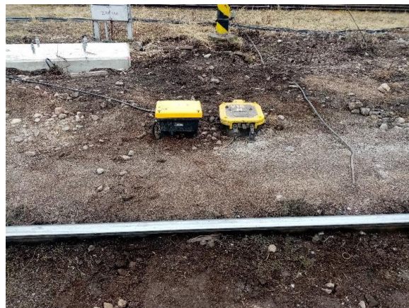
Obr. 12 55-21-03 Traťový úsek odb. a ZAST Varín (vrátane) - Strečno, zabezpečenie stavebných postupov