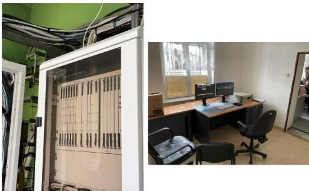
Obr. 2 53-22-04.2C - Žilina - zriaďovačka, dispozičný zapojovač (vpravo)

53-22-10 Žilina Strážov - Váh, úpravy a uvedenie oznamovacích zariadení do prevádzky (vľavo)