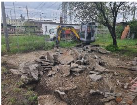
Obr. 22 53-31-02.14 - odstránenie priecestného domčeka - Budatín (vľavo)

53-22-10 Žilina Strážov - Váh, úpravy a uvedenie oznamovacích zariadení do prevádzky (vpravo)