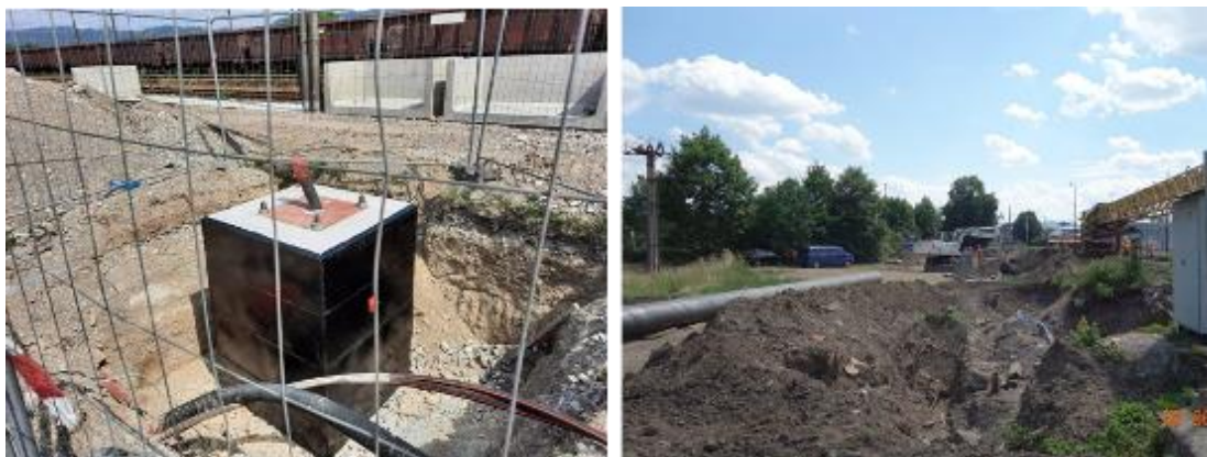
Obr. 26 56-35-04 Žilina - Teplička, VNVK, rozvody NN a osvetlenie (vľavo) 99-35-05 TNS Žilina, pripojenie napájacieho vedenia na trakčné vedenie (vpravo)