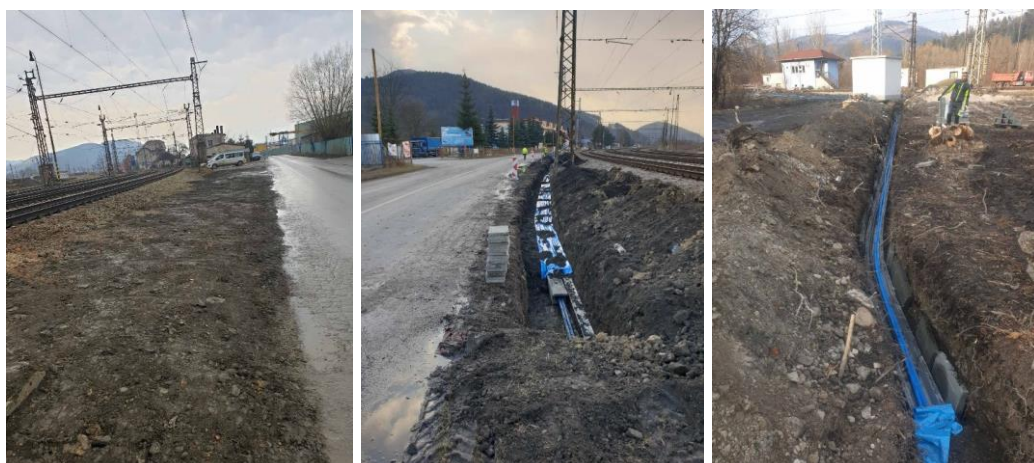
Obr. 10 53-36-03 Žilina Strážov - Váh, preložky oznamovacích káblov „MK-ŽSR“