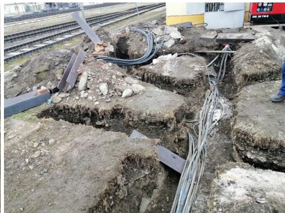
Obr. 13 55-34-03 Traťový úsek odb. a ZAST Varín (vrátane) - Strečno, budova pre železničné zab.zariadenie