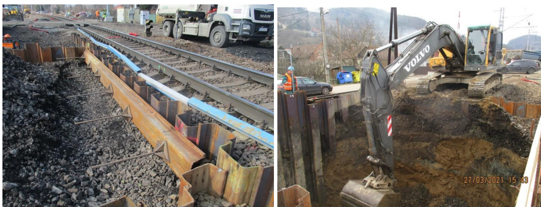
Obr. 7 53-33-01 Žilina Strážov, podchod pre chodcov a cyklistov, sžkm 199,584