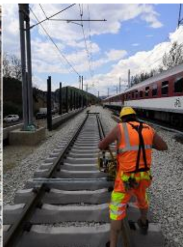
Obr. 17 53-32-01A Žilina Strážov - Žilina os. stanica, železničný zvršok, ŽSR