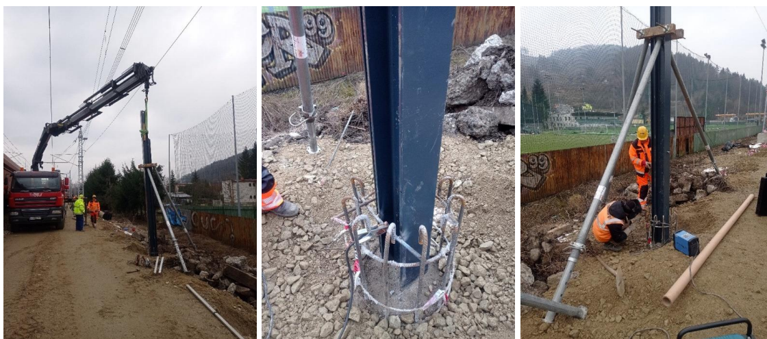
Obr. 8 53-34-06 Žilina Strážov - Váh, protihlukové steny a konštrukcie