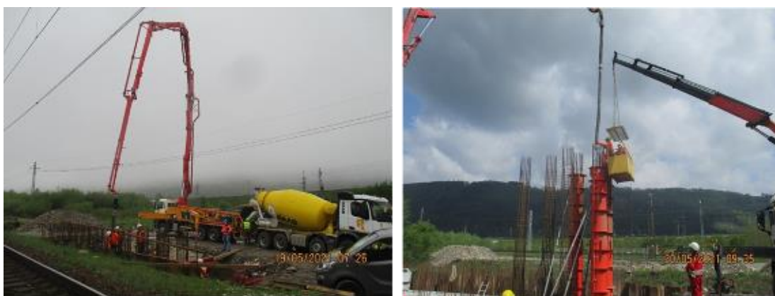
Obr. 20 54-33-01 Traťový úsek Váh - odb. a ZAST Varín, most cestného nadjazdu k TIP, sžkm 335,017