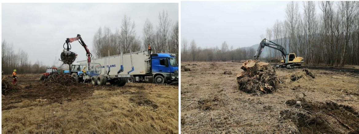
Obr. 3 54-31-02 Traťový úsek Váh - odb. a ZAST Varín, výrub drevín