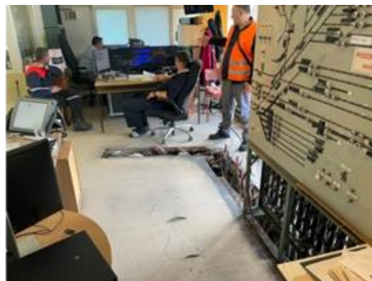
Obr. 23 53-22-10 Žilina Strážov - Váh, úpravy a uvedenie oznamovacích zariadení do prevádzky