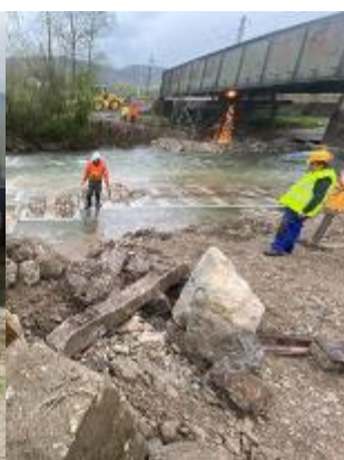
rek. žel. mostov cez