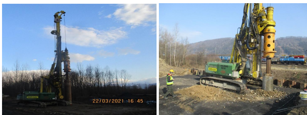
Obr. 11 54-33-01 Traťový úsek Váh - odb. a ZAST Varín, most cestného nadjazdu k TIP, sžkm 335,017