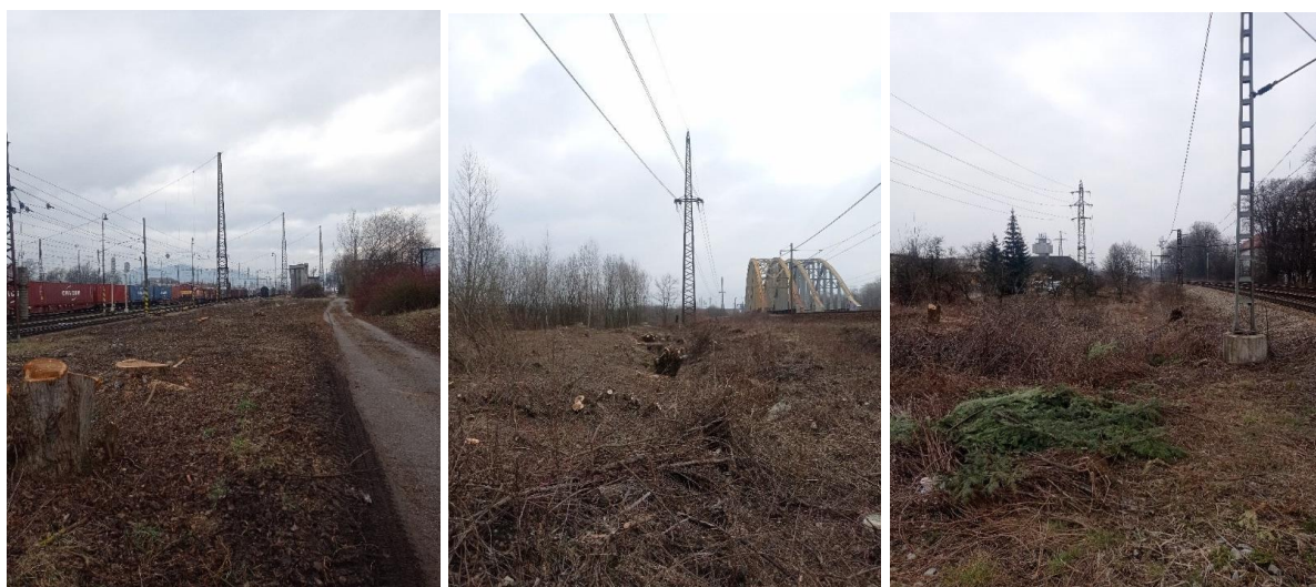
Obr. 4 53-31-03 Žilina Strážov - Váh, výrub drevín