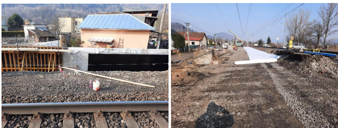
Obr. 5 53-32-02 Žilina Strážov - Žilina os. stanica, železničný spodok