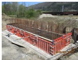
Obr. 15 54-33-01 Traťový úsek Váh - odb. a ZAST Varín, most cestného nadjazdu k TIP, sžkm 335,017