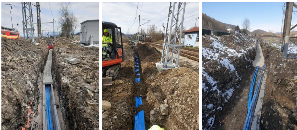
Obr. 9 53-36-02.1 - optických káblov „OK-ŽSR“ - smer Považská Bystrica