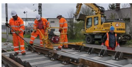
Obr. 14 53-32-03 Žilina os. stanica - Žilina Budatín, železničný zvršok