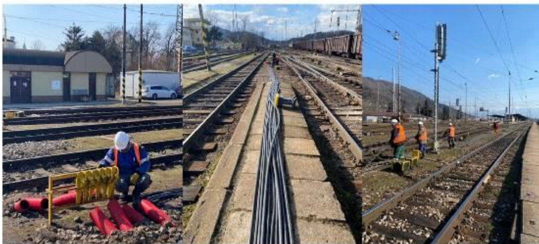
Obr. 1 53-21-07 ŽST Žilina, osobná stanica, zabezpečenie stavebných postupov