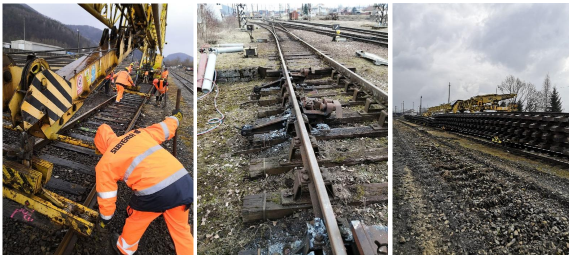
Obr. 6 53-32-09 Žilina Strážov - Žilina os. stanica, železničný zvršok - demontáž