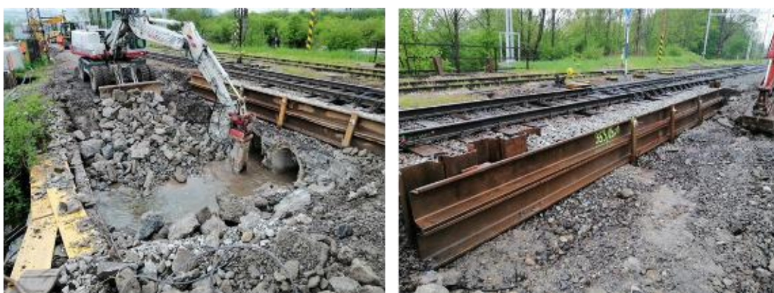
Obr. 21 55-32-09 Traťový úsek odb. a ZAST Varín (vrátane) -Strečno, rekonštrukcia priepustu, sžkm 328,816