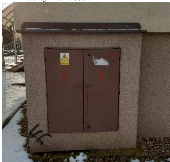
stávající rozvaděč R14