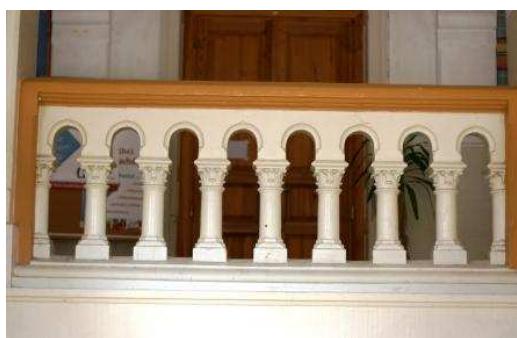
Detail balustrového zábradlia v interiéri radnice v Kecskeméte a schodiskové zábradlie v Červenej škole v Košiciach