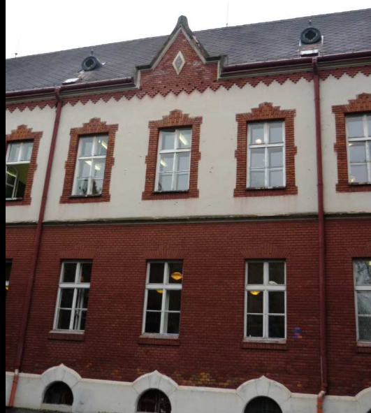
Dvor radnice v Kecskeméte s tehlovým rámovaním okenných otvorov a tehlové rámovanie okenných otvorov na Červenej škole

Motív atikových polkvadrilobových zalamovaných štítov, tehlový obklad a rámovanie nároží a otvorov uplatnený na Červenej škole nachádzame ako dôležitý a dominantný