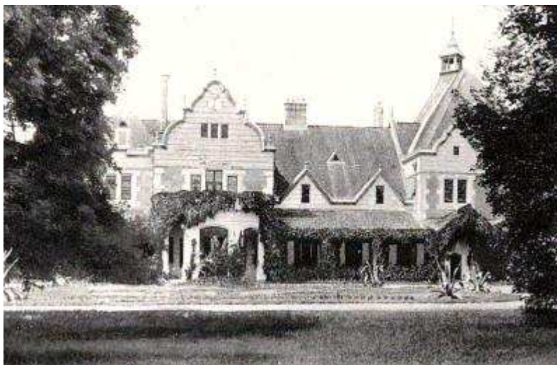
Zámboke, Beniczky kastély, z roku 1895

výrazový prvok rozvinutý aj na jeho ďalšom spoločnom diele s Lechnerom v Zámboke na Beniczky kastély, z roku 1895 17 .