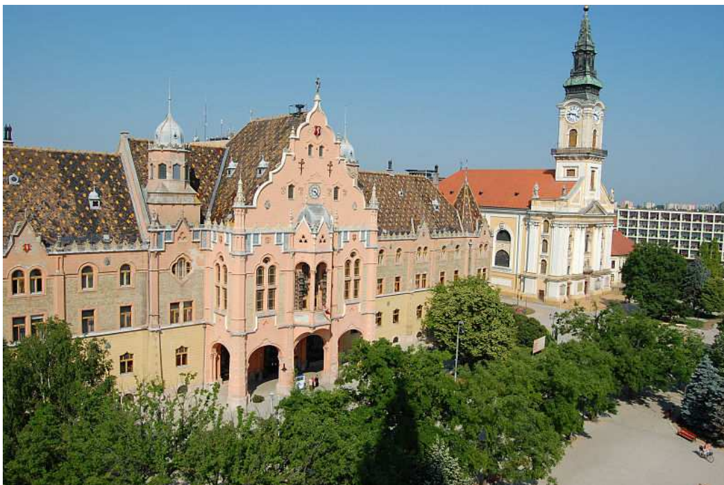
Radnica v Kecskeméte, hlavná fasáda