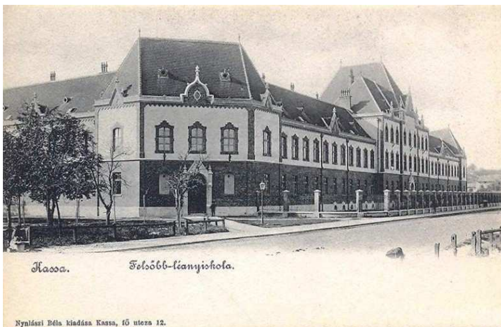
Štátna vyššia dievčenská škola okolo roku 1900, pohľad od severovýchodu

Vo výročnej správe školy z rokov 1896/97 je však údaj, že budova bola vystavaná v novšie ustanovenom maďarskom štýle, podľa umeleckých architektov Lechnera a Pártosa 7 . V dobe vzniku bolo teda hodnotenie štýlu budovy nejednotné.