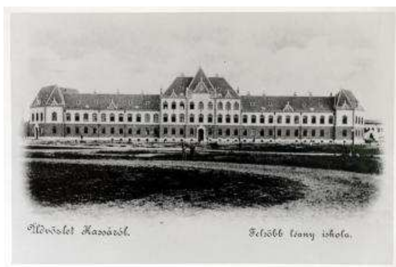
Pohľad na Červenú školu od severu