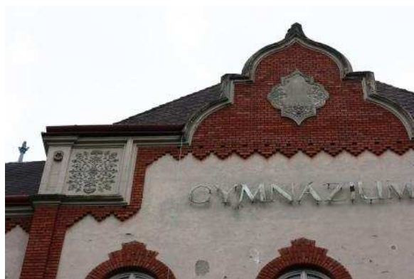
Detail atikového štítu severného rizalitu