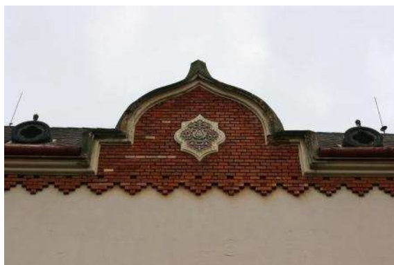
Detail stredového atikového štítu severozápadného rizalitu

Severozápadný skosený rizalit s dominantným pôsobením v Kuzmányho ulici, má do ulice prejavovaný trojboký pôdorys (v dispozícii šesťboký), s bočnými jednoosovými stranami a strednou trojosovou. Je zdôraznený prevýšenou strmou strechou, ktorá má sedlový tvar ukončený po oboch stranách polovičnými ihlanmi. Výzdoba a členenie fasád je rovnaké ako na severnej fasáde: hladký svetlý sokel, tehlový obklad plochy prvého podlažia, kordónová rímsa, hladké svetlé druhé podlažie, hore ukončujúci tehlový vlys s trojuholníkovým