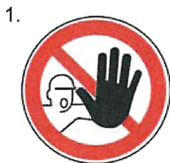
Nepovolaným vstup zakázaný (spolu so značkou č.2, 3 alebo 4 a príslušnou dodatkovou tabuľou)