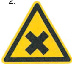
Nebezpečenstvo škodlivej alebo dráždivej látky