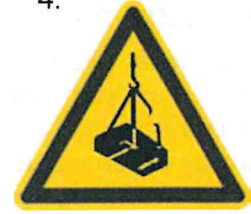
Nebezpečenstvo pádu alebo pohybu zaveseného bremena