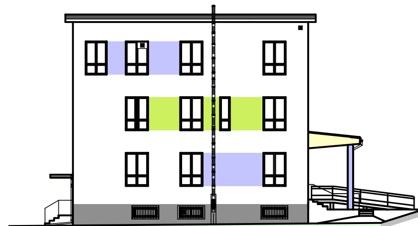
POHLED BOČNÝ - LAVÝ, JUŽNÝ