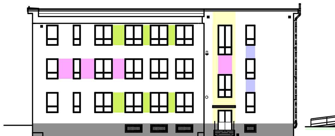
POHLED ZADNÝ - ZÁPADNÝ