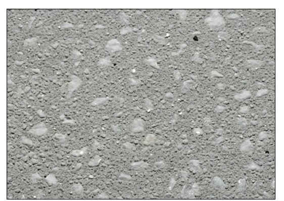
referenčný obrázok - jemne vymývaný betón