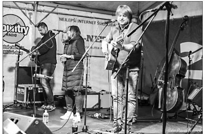
Závěr Bruntálského indiánského léta patří skupině Marien.