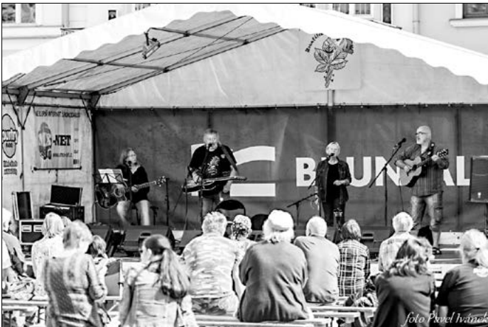
Kapela Welcome Drink po čase opět potěšila své domácí publikum.