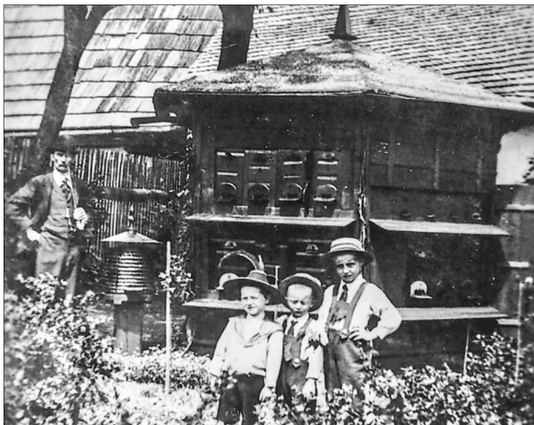
Včelař z Bruntálu se svými dětmi, rok 1920.

V 75 letech byl odsunut do obce Wörnitzstein, zemřel ve věku 91 let.