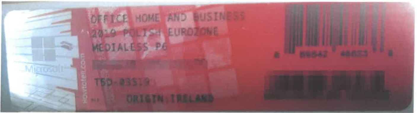
Rys. 2 przykładowy kod zabezpieczony przez producenta systemu Microsoft Windows Office Home&Business z wymazanym, znajdującym się w prawym dolnym rogu numerem seryjnym produktu. Kod licencyjny znajduje się w środku szczelnie zapakowanego i zafoliowanego pudełka (Rys. 3).