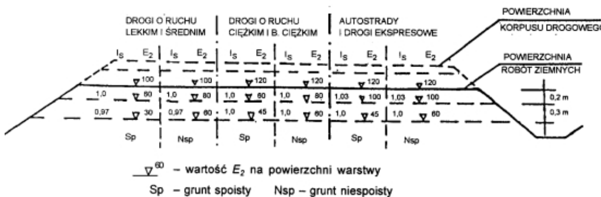
Rys. 1. Wartości wymagane w podłożu wykopów: wskaźnika zagęszczenia I_s i wtórnego modułu odkształcenia E_2 [1].

Wykonawca powinien skontrolować wskaźnik zagęszczenia gruntów rodzimych, zalegających w strefie podłoża nasypu, do głębokości 0,5m od powierzchni terenu. Jeżeli wartość wskaźnika zagęszczenia I_s jest mniejsza niż określona w tabelicy 2, Wykonawca powinien dogęścić podłoże tak, aby powyższe wymaganie zostało spełnione. Jeżeli wartości wskaźnika zagęszczenia I_s określone w tabelicy 1 i na rys 1. nie mogą być osiągnięte przez bezpośrednie zagęszczanie podłoża, to należy podjąć środki w celu ulepszenia gruntu podłoża, umożliwiające uzyskanie wymaganych wartości wskaźnika zagęszczenia I_s .