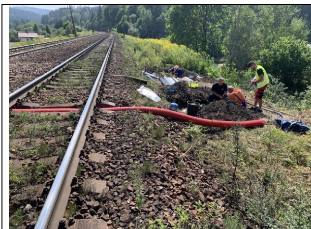
PS 08-21-02 Nultá etapa – úprava zab-zar