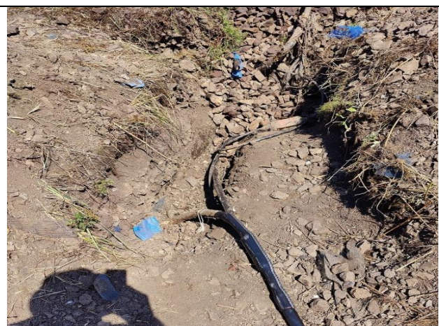
PS 08-22-04 Nultá etapa – úprava zab-zar