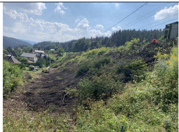
SO 08-31-51 Výrubové práce