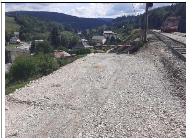
SO 08-33-17 stavenisková komunikácia