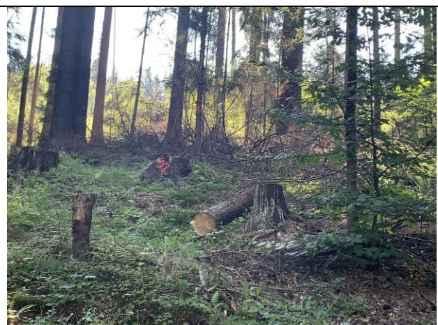
SO 08-31-51 Výrubové práce