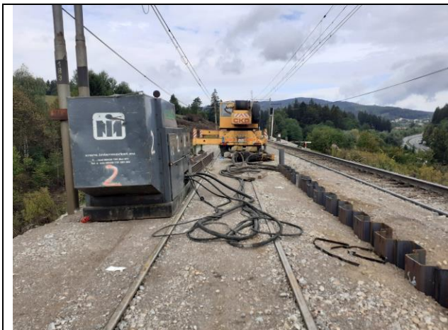
SO 08-33-17 Realizácia štetovnic