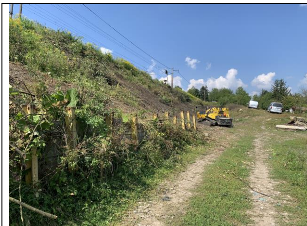
SO 08-31-51 Výrubové práce