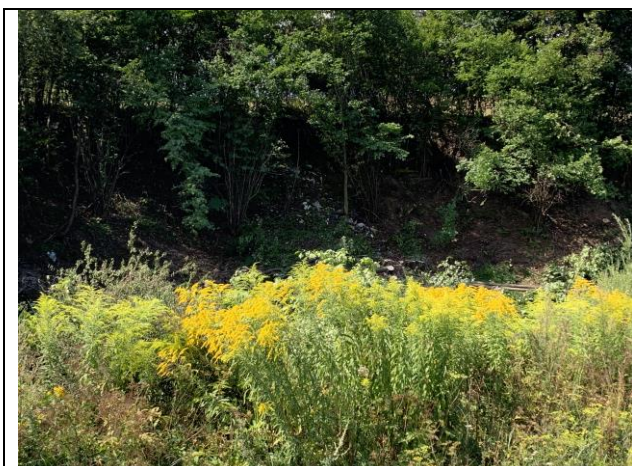
SO 08-31-51 Výrubové práce