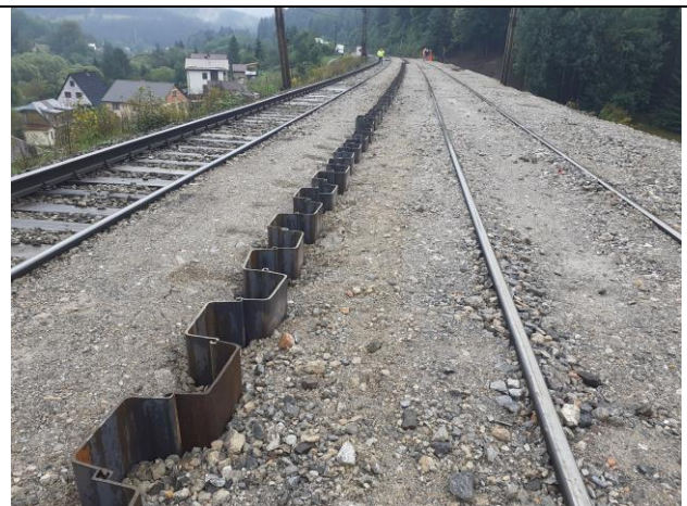
SO 08-33-17 Realizácia štetovnic