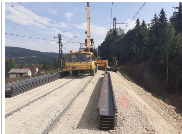
SO 08-33-17 Realizácia štetovnic

Inžinierske združenie BUNG - INFRAM v zastúpení BUNG Slovensko s.r.o., Ružová dolina 6, 821 08 Bratislava