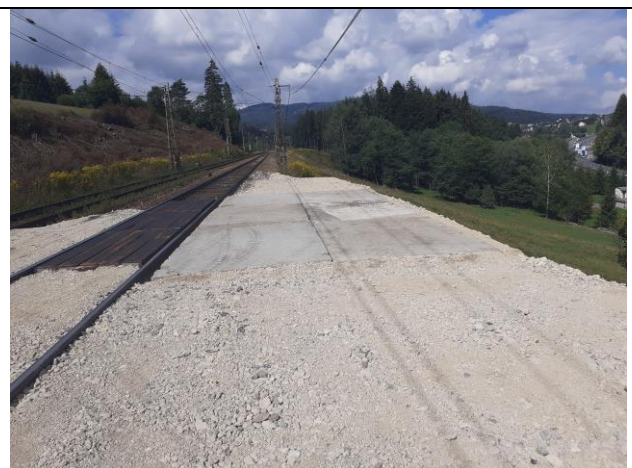
SO 08-33-17 Realizácia štetovnic