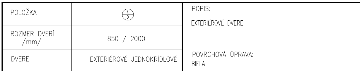
SCHÉMA VÝROBKU POHLAD Z EXTERIÉRU