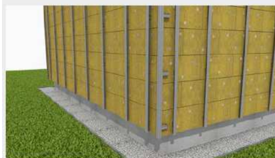
Mocowanie profili podkonstrukcji do konsol.