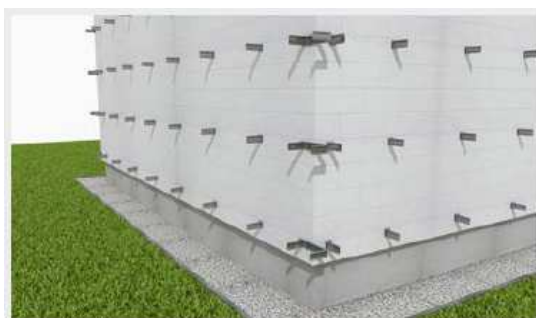
Montaż konsoli do ściany.