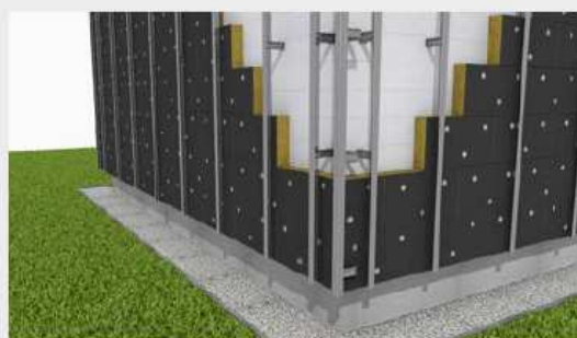
Mocowanie profili podkonstrukcji do konsol.