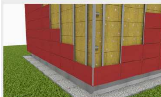
Zamocowanie płyt elewacyjnych.