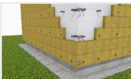
Ułożenie i zakotwienie wełny do ściany.