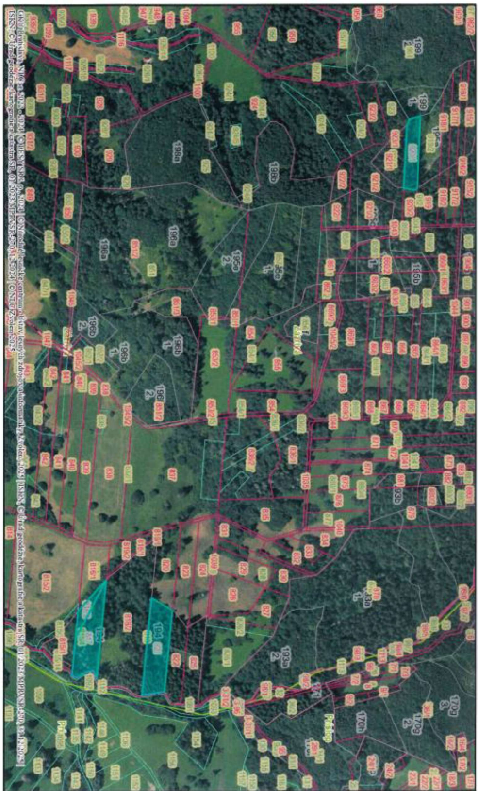
Príloha č. 1.

Výberová dňa: 19.03.2026 Výstup z aplikácie: WebGIS