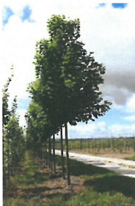
Acer platanoides 'Emerald Queen'