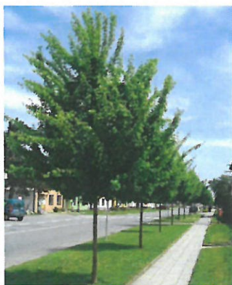
Acer campestre 'Elsrijk'

Plocha nádvoria objektu pre seniorov je riešená s prístupovou komunikáciou do nádvoria a parkovisko pre osobné automobily. Oddeľujúce pásy stojísk sú využité na chodník pre peších, ostatné pásy budú zatravnené a vysadené vzrastlými stromami. Tie členia spevnenú plochu na menšie celky, vytvárajú tieň a celé nádvorie s prevládajúcim dláždeným povrchom takto spríjemňujú. Navrhnuté sú druhy so stredne veľkými korunami nenáročné na rastové podmienky a údržbu. Keďže dobre znášajú rez, pri pravidelnej údržbe korún je predpoklad, že nebudú prekážať vozidlám v rozhlade a vytváraním tieňa budú v horúcom letnom období čiastočne ochladzovať priestor. Navrhnuté sú kultivary javora poľného Acer campestre 'Elsrijk', javora mliečneho Acer platanoides 'Emerald Queen' a jablňou okrasnou Malus Royalty . Celkový počet stromov je 12 kusov. V predpolí objektu a pri vstupe do nádvoria sú v trávniku navrhnuté trvalkové záhony. Súčasťou nádvoria je navrhnutá prístavba jestvujúceho objektu - zimná záhrada, ktorá je riešená v rámci iného projektu.