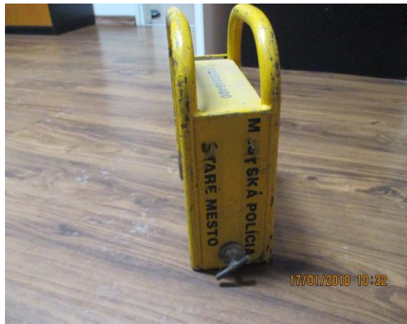
ilustračný záber obr.4,5