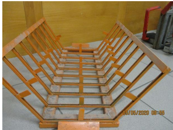
ilustračný záber obr.6