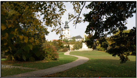
Nitriansky hrad na jeseň