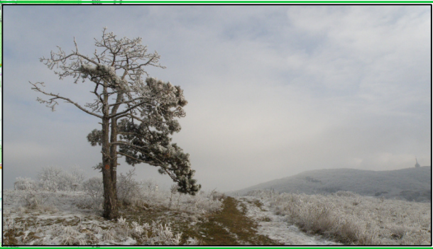
Zobor - územie Natura 2000