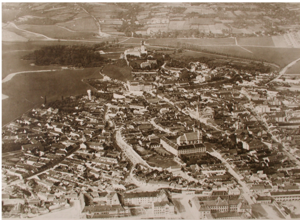
Centrum Nítry - historická pohľadnica