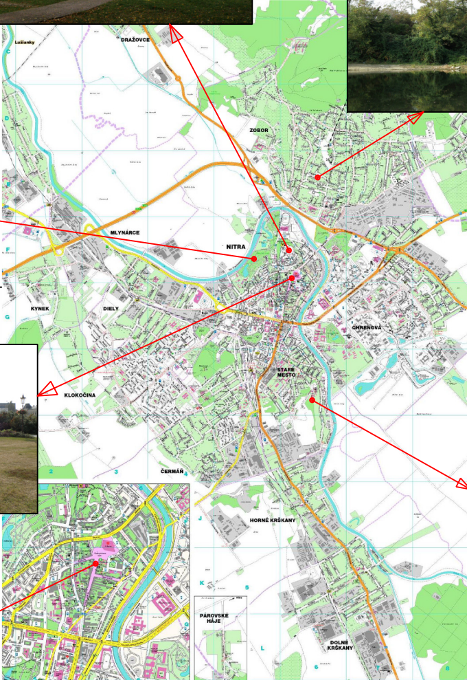
Významné lokality v meste