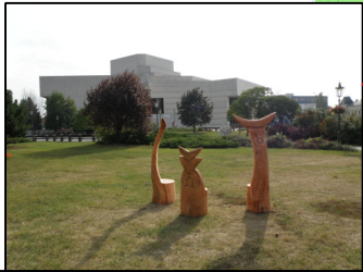
Divadlo A. Bagara