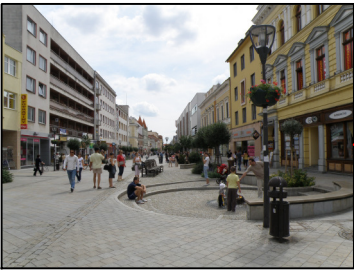
Pešia zóna v Nitre