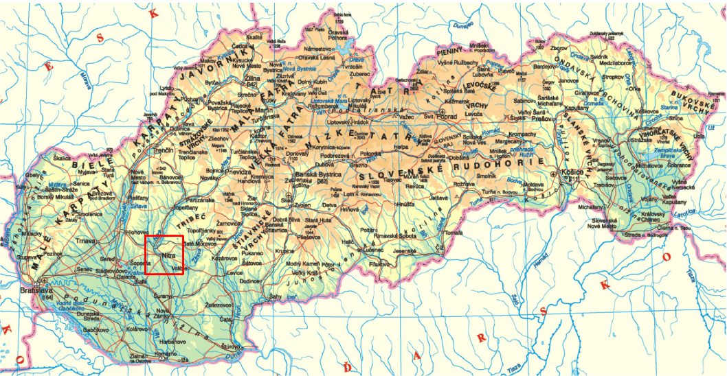
SLOVENSKO a Nitra