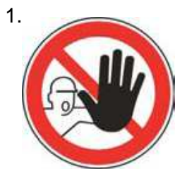
Nepovoleným vstupom zakázaný (spolu so značkou č.2, 3 alebo 4 a príslušnou dodatkovou tabuľkou)