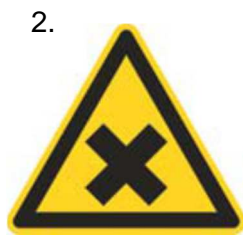
Nebezpečenstvo škodlivej alebo dráždivej látky