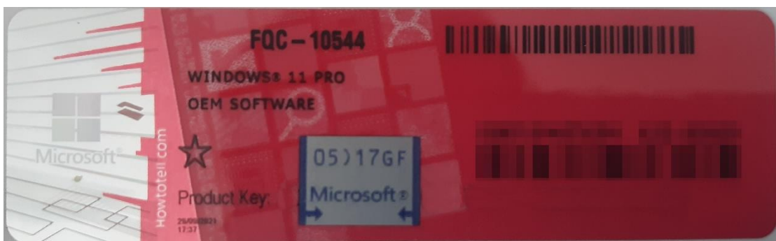
Rys. 1 przykładowy kod zabezpieczony przez producenta systemu Microsoft Windows 11 (takie same naklejki mają Windows 10) z wymazanym, znajdującym się przed i za szarą naklejką kodem licencyjnym

Poniższe zdjęcie obrazuje obecnie stosowane zabezpieczenia producenta firmy Microsoft (klucz systemu jest zabezpieczony naklejką hologramową przez producenta. Po jej zdrapaniu uzyskujemy dostęp do oryginalnego klucza):