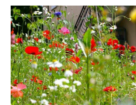
VÝSADBA LÚČNYCH KVETOV

Aj lúčne kvety majú svoje miesto v záhrade. Lúka v záhrade prináša krásu, nespútanosť a harmóniu v podobe farieb, vôní, zvukov a nového života.