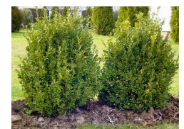
KRUŠPÁN VŽDYZELENÝ / BUXUS SERPERVIRENS /

Buxus alebo krušpán patrí k obľúbeným okrasným drevinám. Predstavuje vždyzelený ker alebo malý strom, pestuje sa ako vo veľkých nádobách, tak aj v záhradách. Krušpán vytvára protistojné vajcovité listy. Je pre ne príznačné, že sú hladké a kožovité. Žlté kvety sa tvoria v pazuchách listov v marci a apríli. Plodom je tobolka.