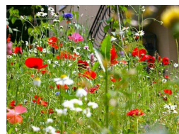
KVETINOVÝ ZÁHON Z CIBULOVÍN

Cibuloviny a hlúznaté rastliny rozkvitajú už od marca a mnohé kvitnú ešte aj v máji. Hodia sa ako do moderných mestských záhrad, tak aj na vidiek. Samozrejme, vždy je dôležité vybrať si správne druhy a kultivary. Výškovo ich usporiadajte tak, aby nižšie boli na záhonoch v popredí a vyššie v pozadí, môžete ich vysadiť tiež k chodníkom, nižšie druhy do skaliek, vresovísk či vegetačných nádob, mnohé (napríklad tulipány a nižšie korunkovky) budú pôsobiť aj pri jazierkach. Nádherné sú aj bohato zakvitnuté trsy rôznych cibulovín – narcisov, korúnok a tulipánov – v udržiavanej trávnej ploche.