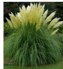
PAMPOVÁ TRÁVA STRIEBORNÁ / CORTADERIA SELLOANA /

Pampová tráva je mohutná okrasná tráva. Svojimi obrovskými vejármi patrí k najväčším dekoráciám na záhrade. Celková výška rastliny je okolo 2,5 m. Listy dosahujú dĺžku až 1,5 metra. Rozrástá sa aj do priestoru - do šírky. To treba brať do úvahy pri sadení.