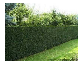
HRAB OBYČAJNÝ / CARPINUS BETULUS /

Hrab obyčajný rýchlorastúci živý plot 20/40 cm patrí medzi opadavé listnaté stromy. Má krásne jasne zelené listy a na jeseň sa menia na sýto žltú farbu. Úplne mrazuvzdorný. Rýchlorastúci živý plot ktorý možno ľubovoľne a kedykoľvek tvarovať, je nenáročný na zálievku, no ak jej má dosť rastie doslova ako z vody. Veľkým plusom sú aj jeho listy, pučí niekoľko krát ročne, takže stále prináša nové a nové listy. Na zimu však neopádavajú, takže vytvárajú nepriehladnú stenu.