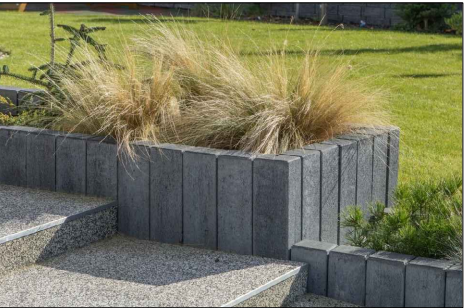
Palisády okolo spevnenej plochy