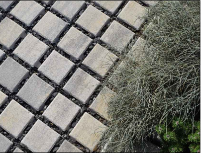
Vodopriepustná plocha pred OÚ