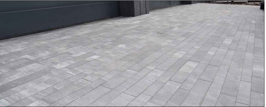
Betónová dlažba na chodník