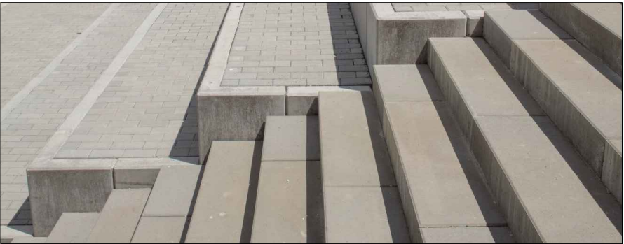
Betónové schody z prefabrikátu