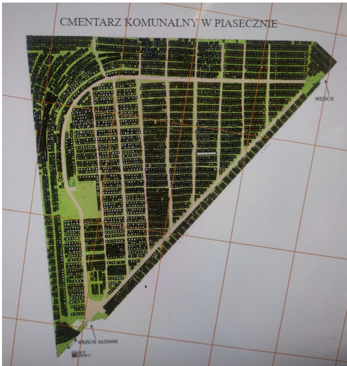
Nieruchomość przy ul. Julianowskiej 27

uwaga: ten dokument jest chroniony prawem autorskim prawa autorskie majątkowe: Przedsiębiorstwo Usług Komunalnych Piaseczno Sp. z o.o.