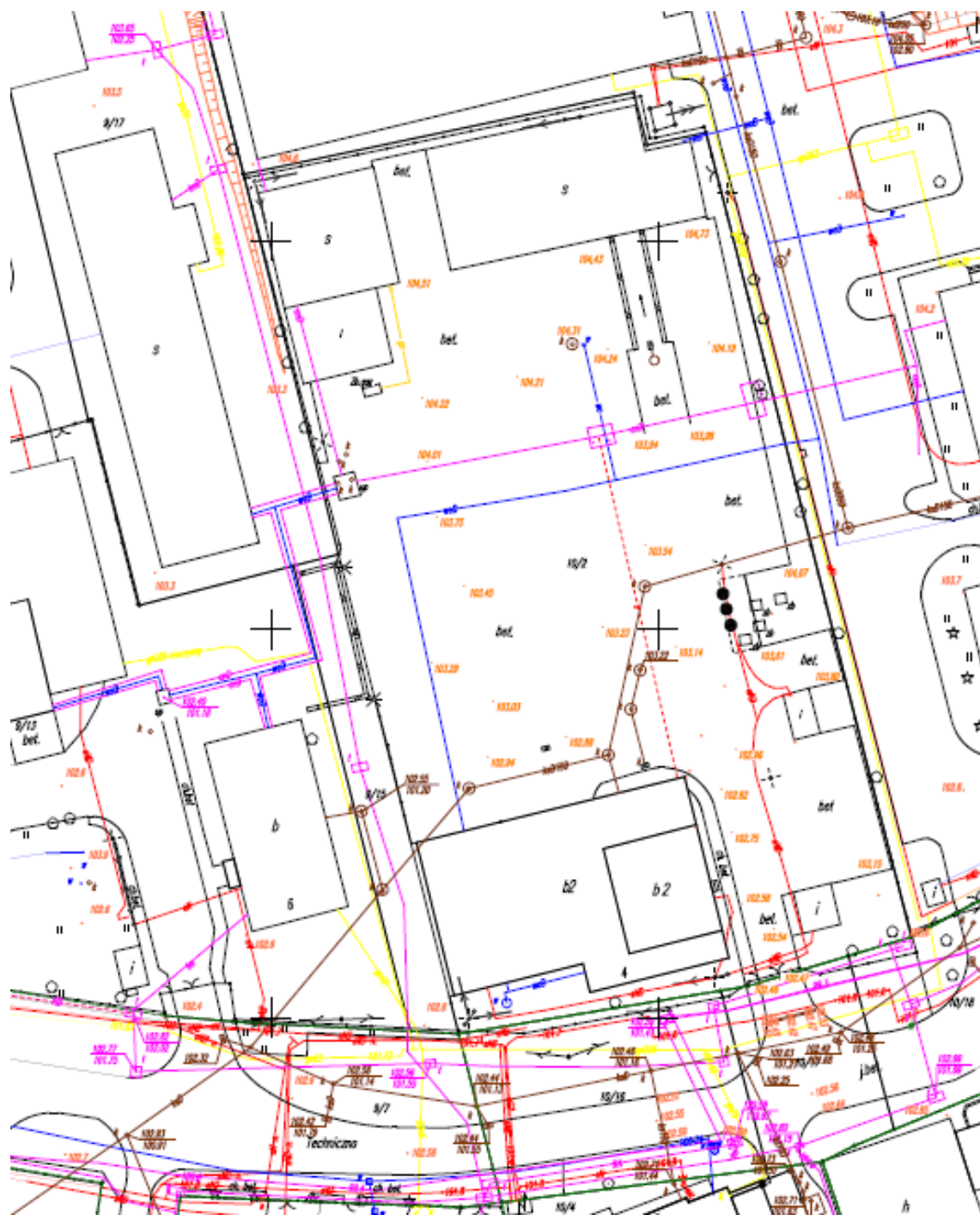
Nieruchomość przy ul. Technicznej 4

uwaga: ten dokument jest chroniony prawem autorskim prawa autorskie majątkowe: Przedsiębiorstwo Usług Komunalnych Piaseczno Sp. z o.o.