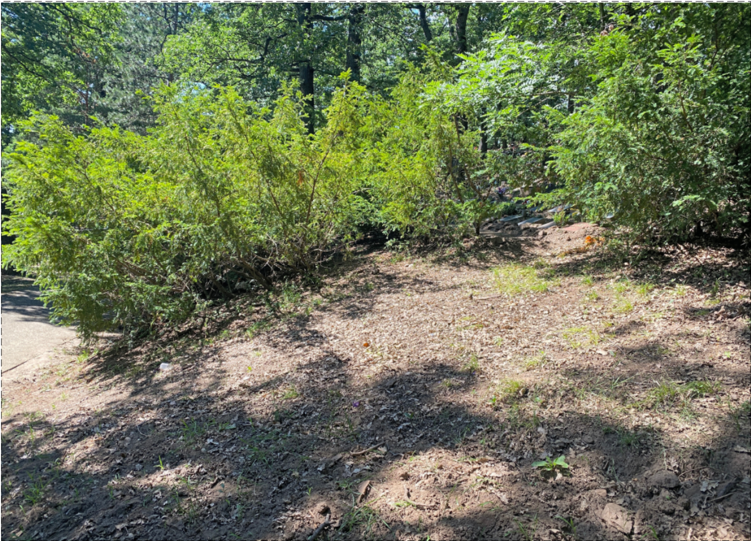
FOTO Č.3 POHLAD NA RIEŠENÉ ÚZEMIE