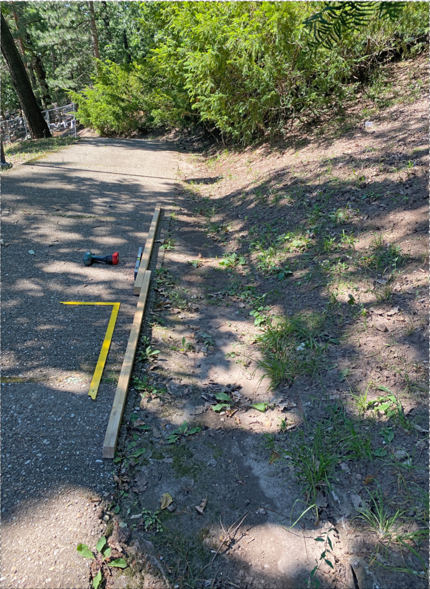
FOTO Č.1 POHLAD NA JESTVUJÚCI ODTOKOVÝ ŽĽAB (ROZHRIANIE CHODNÍKU A RIŠENÉHO MIESTA)