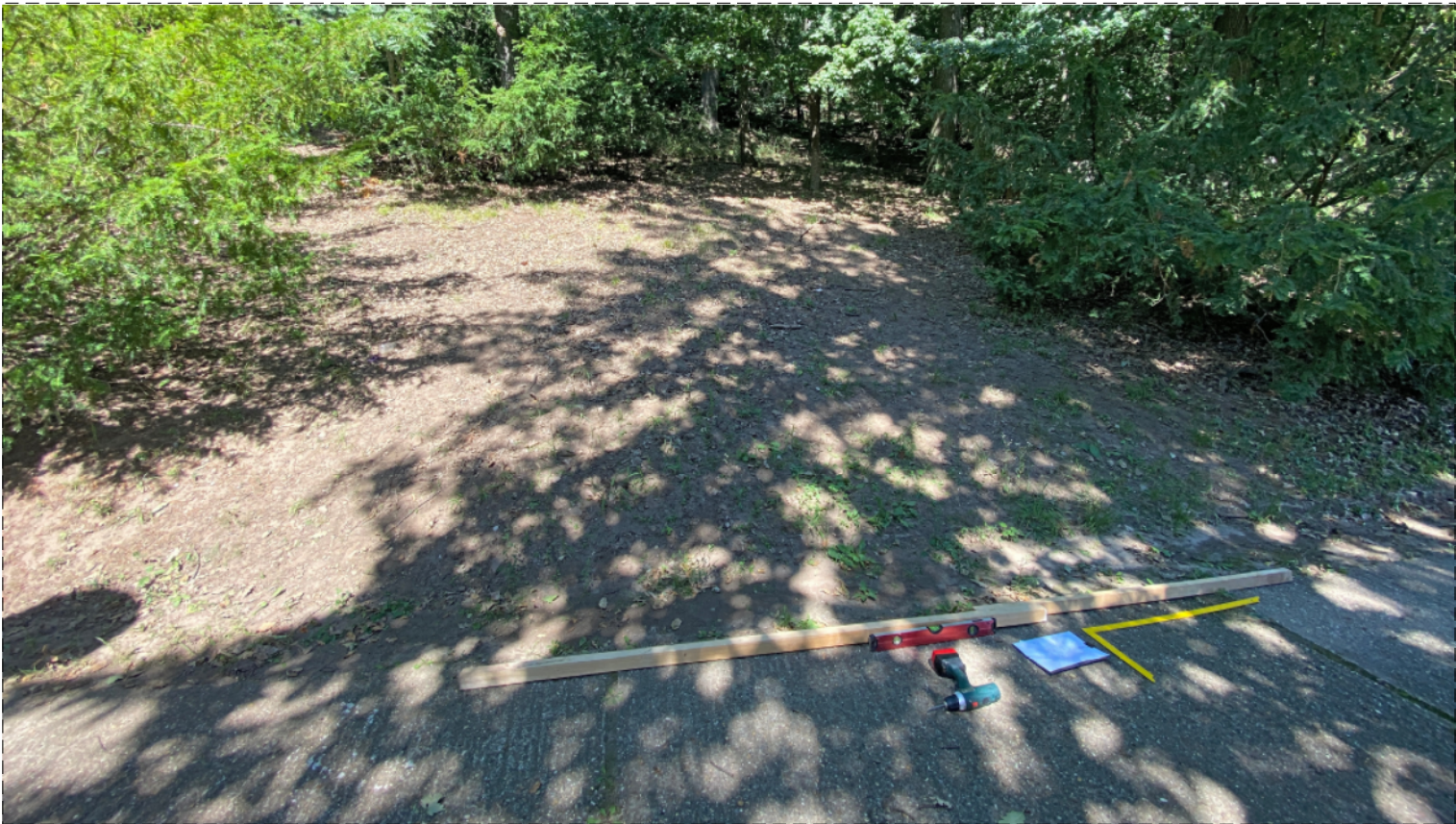
FOTO Č.2 POHLAD NA RIEŠENÉ ÚZEMIE