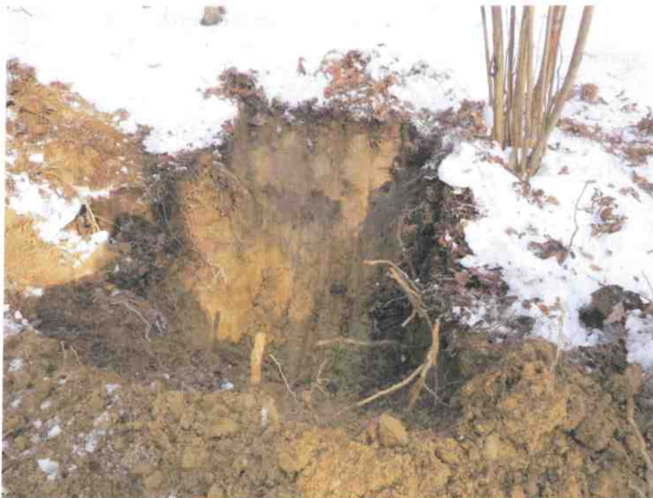
Obr. č.4. Ilovito- hlinité podložie je vhodný zdroj pre ílové tesnenie F6.