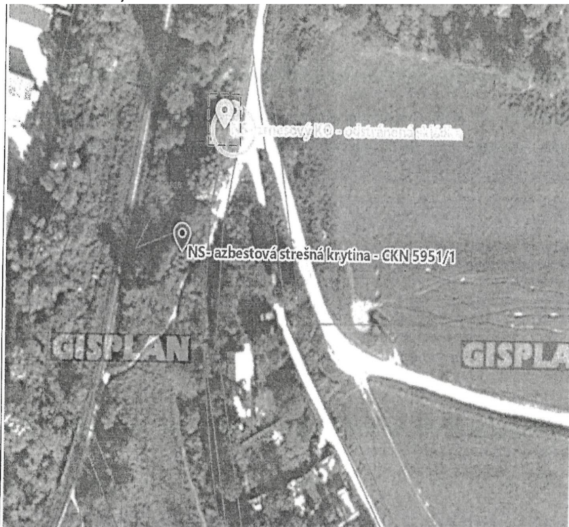
Skládka č.1 – k.ú. Bardejov