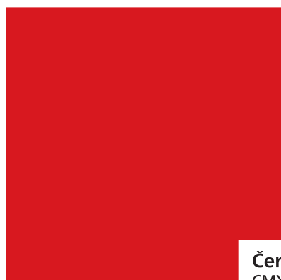
Červená BA CMYK (%) 0 / 100 / 100 / 10 RGB (0-255) 183 / 0 / 11 Pantone 485

Popis týchto farieb je uvedený pre systémy CMYK a RGB a pre systém priamych farieb Pantone.