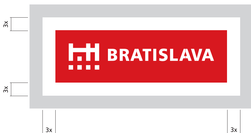
ochranná zóna v okolí negatívnej značky v poli