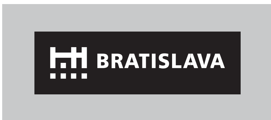
značka v čiernobielom negatívnom prevedení v čiernom poli