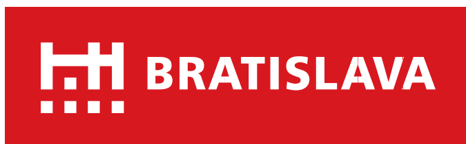
značka v jednofarebnom negatívnom prevedení v poli