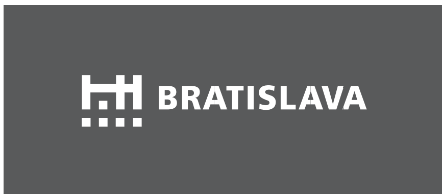
značka v čiernobielom negatívnom prevedení