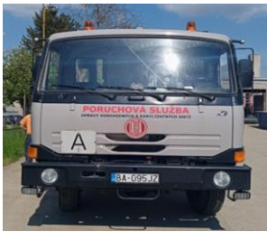
Položka č. 1: BA095JZ