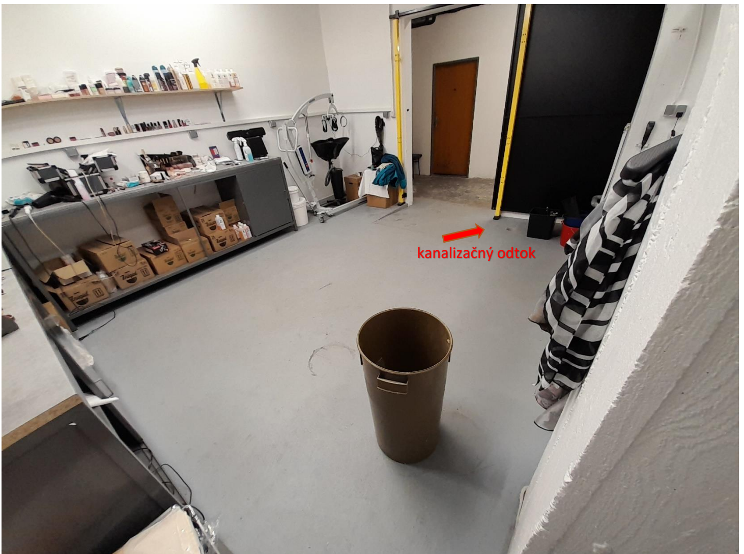
3/ Miestnosť úpravne zosnulých