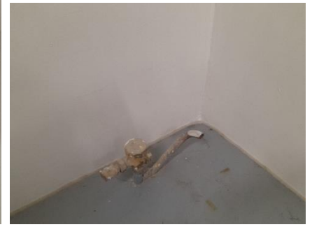
4/ Nefunkčné ZTI potrubie v rohu miestnosti