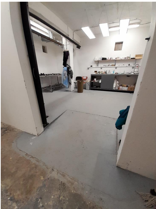
1/ Vstup do miestnosti (rampa)