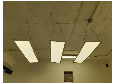
5/ Osvetlenie miestnosti – stropné svietidlá (závesné – 3 ks a pevne kotvené – 2 ks)