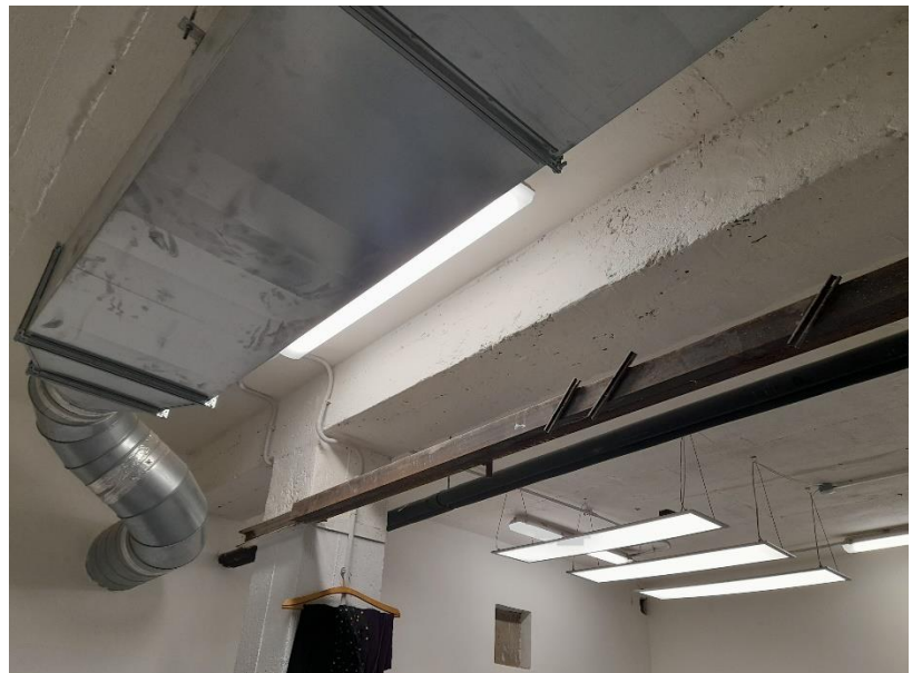
6/ Požiadavka na doplnenie 1 ks závesného svietidla – umiestnenie pod VZT potrubie