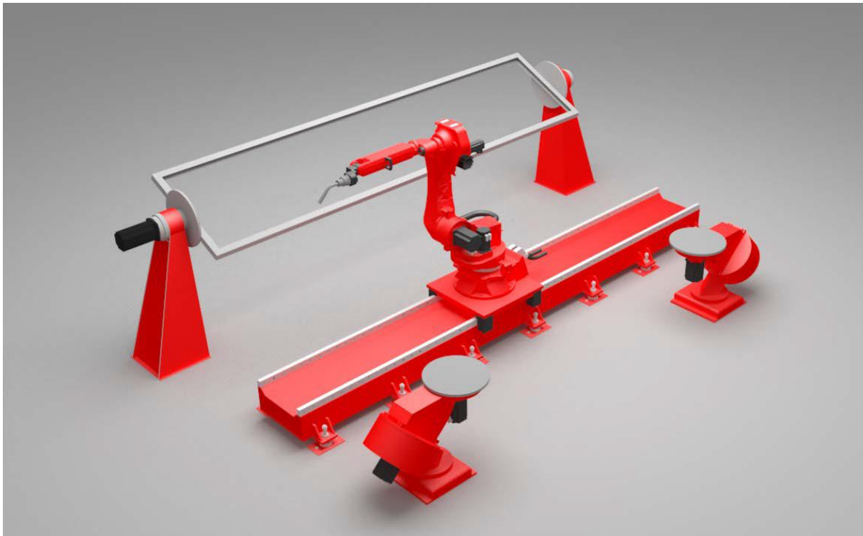
Ilustračný návrh usporiadania- Robotizované pracovisko - zváracie