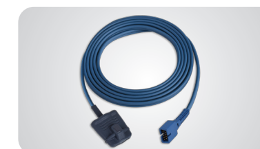
Mäkký snímač pre dospelých