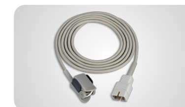
Pediatrický klipový snímač