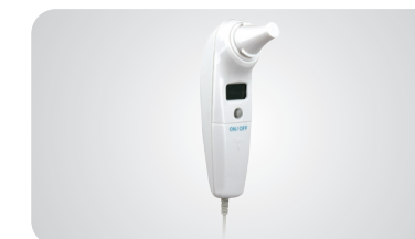
Infračervený ušný teplomer