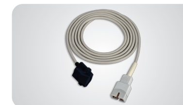
Pediatrický mäkký snímač