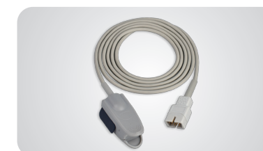
Senzor s klipom pre dospelých