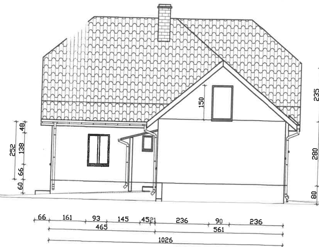
Elewacja północna 1:100