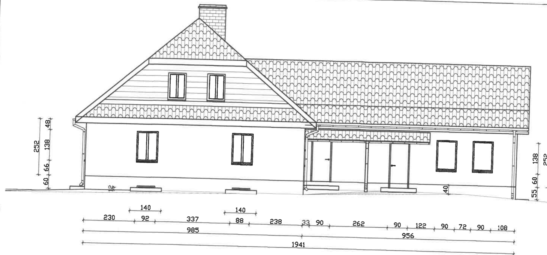
Elewacja zachodnia 1:100