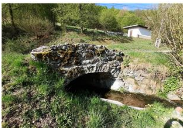
Názov: Most 2421-007(03).jpg