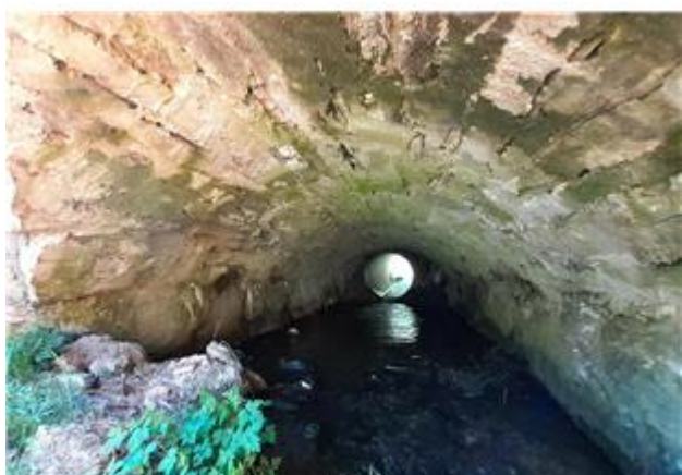
Názov: Most 2421-007(04).jpg