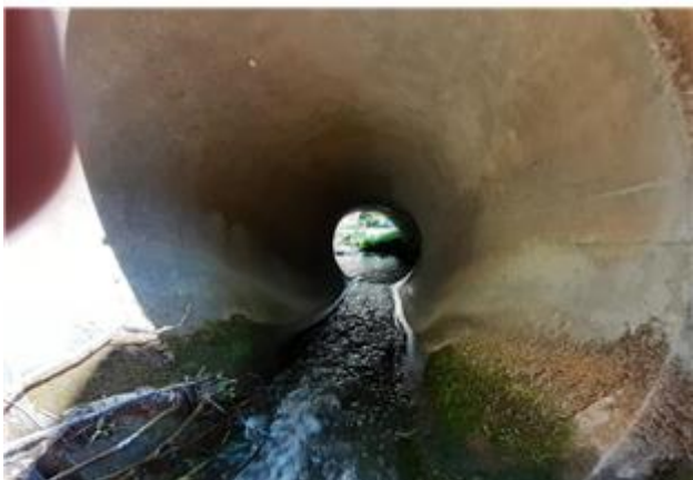
Názov: Most 2421-007(11).jpg