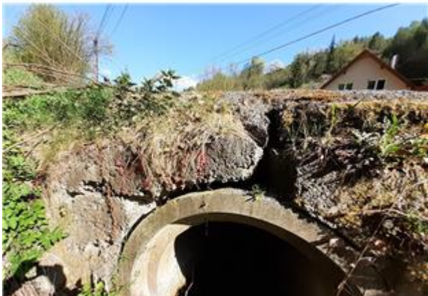
Názov: Most 2421-007(10).jpg