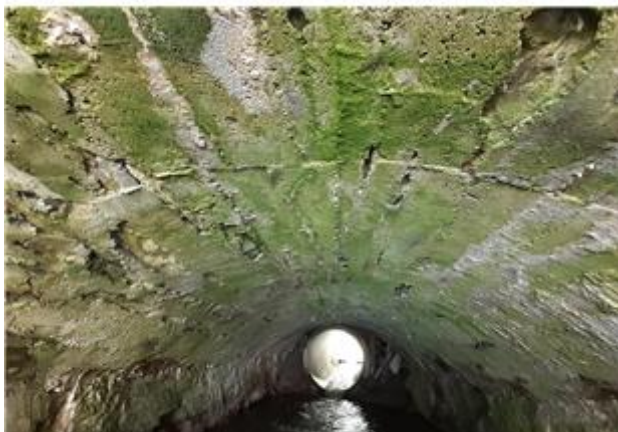
Názov: Most 2421-007(08).jpg