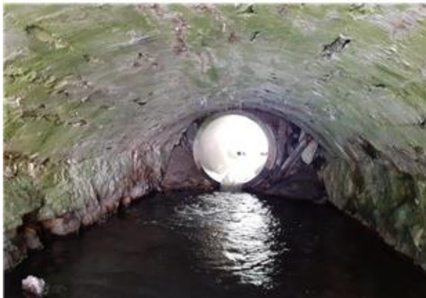
Názov: Most 2421-007(07).jpg