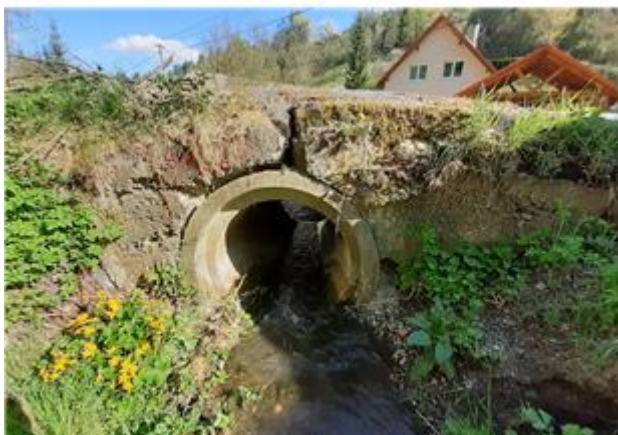
Názov: Most 2421-007(09).jpg