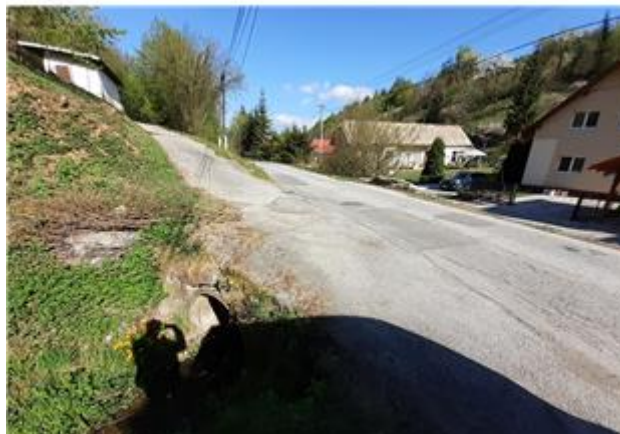
Názov: Most 2421-007(01).jpg