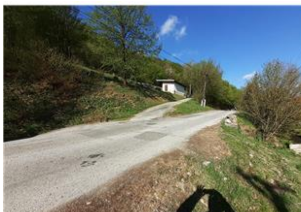
Názov: Most 2421-007(02).jpg