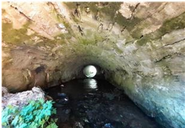
Názov: Most 2421-007(06).jpg