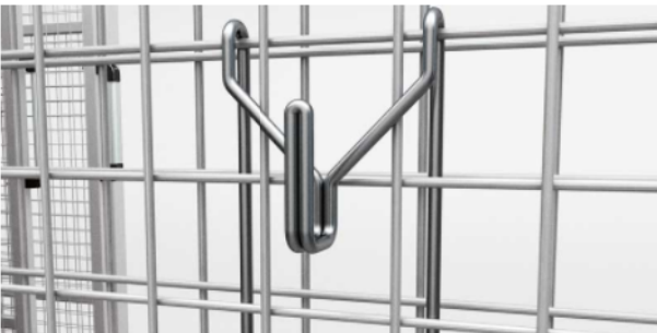
systém dvojitého sita a háčik na vešanie - malý háčik Ø 2,5mm /nosnosť 50kg/ veľký háčik Ø 4mm /nosnosť 100kg/

súčasťou dodávky regálu je jeho označenie. označenie je formátu A4 ( 210x 297mm). pevná podložka s priehľadným obalom, do ktorého sa dá vkladať hárok papiera formátu A4. Papier sa dá ľahko meniť, aby sa obsah mohol podľa potreby aktualizovať. spôsob uchytenia pevnej podložky je realizovaný tak, aby nezasahoval do priestoru uskladňovaných premetov.kazdý jeden regál má vlastné označenie.