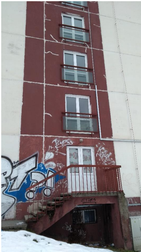
Schéma a fotografie objektu

Budova internátu je postavená panelovým konštrukčným systémom T06B, nezateplená, okná vymenené v roku 2017 spolu s rekonštrukciou balkónových zostáv, strecha nezateplená, zrekonštruovaná asi pred 15 rokmi. Vykurovanie riešené kompaktnou odovzdávacou stanicou. Radiátory pôvodné liatinové, zostanú zachované. Budova internátu má vypracovaný tepelno-technický posudok z roku 2015.