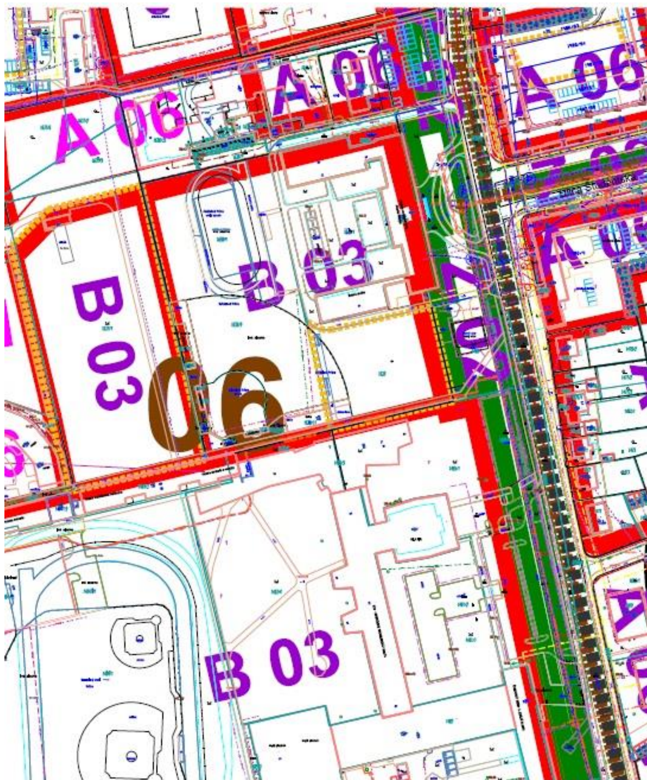
Príloha č. 1 Výrez z výkresu regulačívov územného plánu mesta Trnava