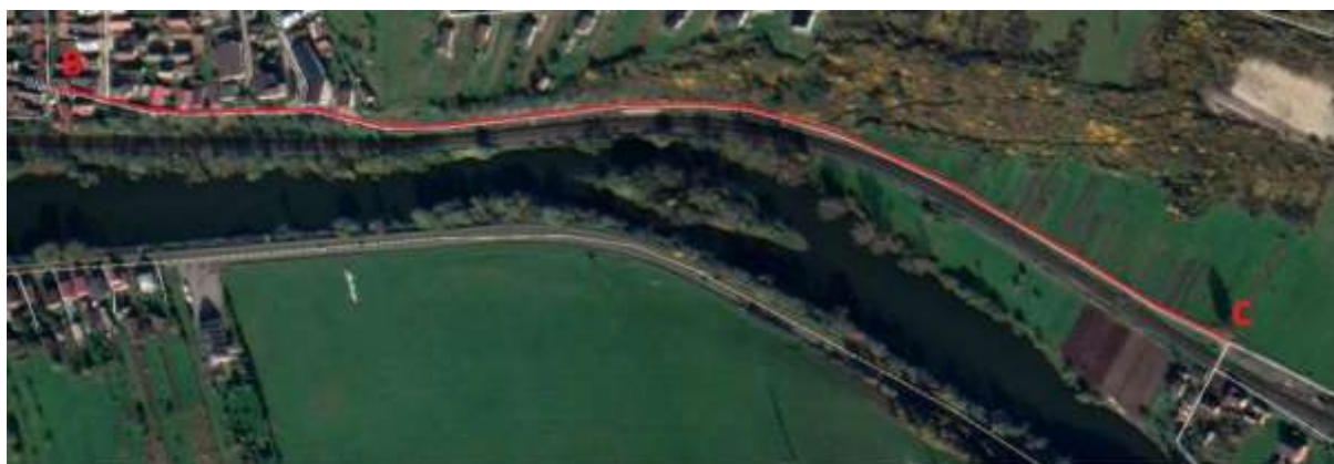
Obr. 3 – 2 Úsek B - C