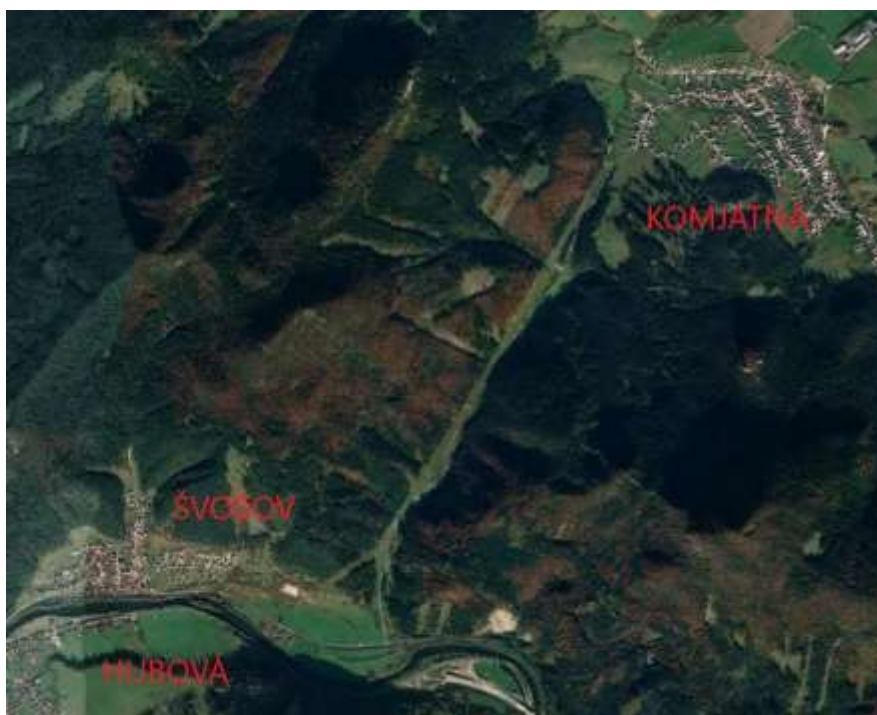
Obr. 1 - 1

Švošov ( Obr. 1 – 1) je obec v okrese Ružomberok. Dopravné spojenie s Ružomberkom je zabezpečené cestou III/2211 a I/18. Cez obec prechádza dvojkoľajná železničná trať č.180, ktorá spája Žilinu a Košice. Je súčasťou V. železničného koridoru a patrí medzi najdôležitejšie železničné trasy na Slovensku vzhľadom na intenzitu dopravy.