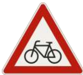
Obr. 3 – 3 Značka č. 143