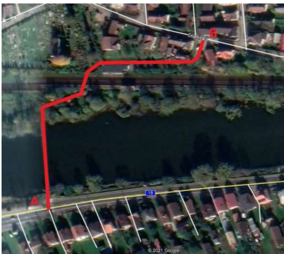
Obr. 3 – 1 Úsek A - B

Prvá etapa výstavby regionálnej cyklotrasy Hubová - Švošov - Komjatná bude mať začiatok v obci Hubová na prahu lávky cez rieku Váh medzi obcami Hubová a Švošov ( Obr. 3 – 1). Cyklotrasa bude pokračovať cez lávku do obce Švošov, kde sa bude križovať s medzinárodnou cyklotrasou ( Vážska cyklomagistrála ) a koniec prvej etapy bude neďaleko futbalového ihriska v bode C (Obr. 3 - 2). V ďalších etapách výstavby bude pokračovať smerom do obce Komjatná, kde na začiatku obce bude koniec tejto cyklotrasy.