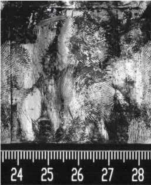
FINGERMARKS ON A AA SIZE BATTERY DEVELOPED WITH CYANOACRYLATE. BATTERY WAS THEN ROLLED OVER A BLACK GELLIFTER. AFTER LIFTING THE MARKS WERE EASILY IMAGED AND SHOW UP IN GOOD CONTRAST.