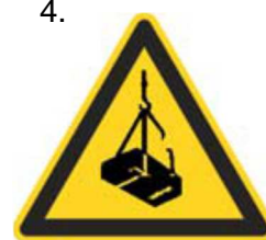
Nebezpečenstvo pádu alebo pohybu zaveseného bremena