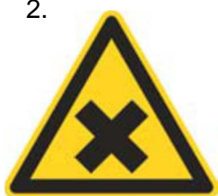
Nebezpečenstvo škodlivej alebo dráždivej látky