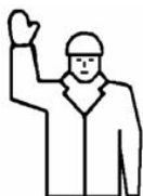
STOP Prerušenie Koniec pohybu

všeobecne platný signál – STOJ! (platný vo všetkých priestoroch objednávateľa)