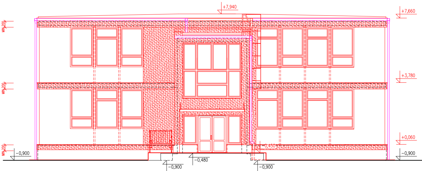
POHLAD "C" – severovýchod